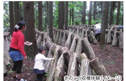
きのこの収穫体験(イメージ)

きのこの収穫体験などができる施設やお絵かきタウンができました。4月15、16日は巨大パエリア作りやバルーンアート等、イベント盛りだくさん。