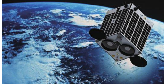
超小型人工衛星