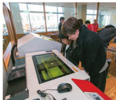
レーザーカッター

また、近年、小型の人工衛星を使って地表を観測する新ビジネスの動きが出ています。このチャンスを捉え、衛星から得られるデータを活用するためのシステム開発も進んでおり、ビジネスの広がりに期待が寄せられます。