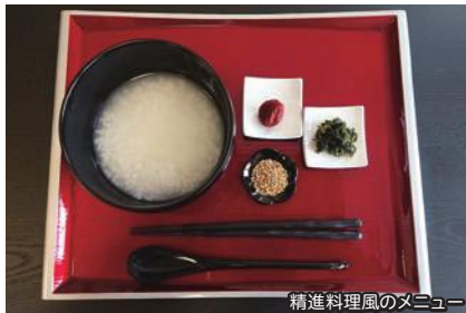
精進料理風のメニュー

精進料理風のメニューや「禅」を体感できる映像コーナーが誕生しました。3月26日は精進カレー汁の振る舞いやサクラマスの刺身試食、缶バッジ作り体験を開催。