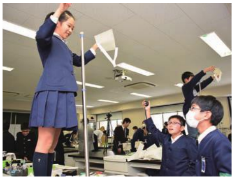
小学生部門(滞空時間の長い紙プロペラの条件を探す課題)

理科や数学に対する知的好奇心を高め、思考力や表現力を育成することを目的として、中・高生を対象に開催してきた「ふくい理数グランプリ」に、28年度から新たに小学生部門を加えました。理科部門と算数部門に分かれ、チームで話し合い、協力しながら課題に取り組みます。試行錯誤しながら問題を解く楽しさを味わってもらうことにより、理科や算数が好きな子どもたちの裾野を広げられます。