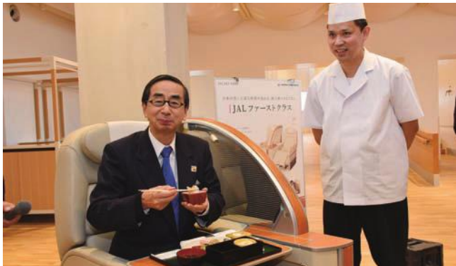
機内食を試食する西川知事

県とJALは共同して、3月1日からの1か月間、福井の観光地や食をPRします。嶺北北部、嶺南に続き、3回目となる今回は、丹南地区にスポットを当てます。