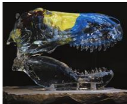
坂井市春江町東太郎丸3-1 ☎0776-51-8000 開9時30分～17時 休月曜(祝日を除く)、祝日の翌日