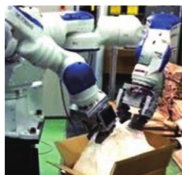
人との共同作業が可能な双腕ロボット

新素材の活用や、生産工程の効率化等が進んでいます。本県が優れた製造技術を持つ新素材の一つは炭素繊維。軽くて強いという特性を生かし、県内企業が開発に携わった部材がすでに航空機エンジンに使われています。今後、主翼や胴体にも使える