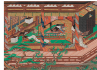
岩佐又兵衛「上瑠璃物語絵巻」(4巻部分)

■「岩佐又兵衛展-この夏、謎の天才絵師、福井に帰る-」 7月22日(金)～8月28日(日)9時～17時 詳浮世絵の祖とされ、一世を風靡した又兵衛が福井で制作した代表作を中心に、個性的な画風の世界を紹介。 料一般1200円、大高生800円、中小生500円