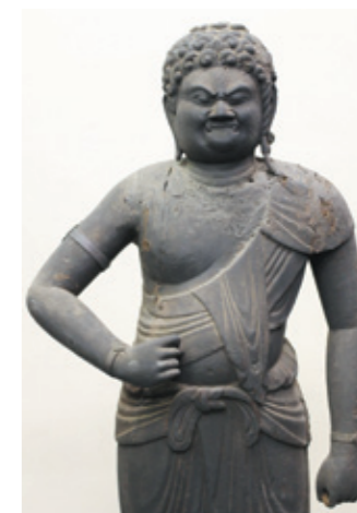
不動明王立像(妙楽寺)

■「若狭の仏像・仏画 不動明王像」展 7月2日(土)～31日(日) 詳 若狭に伝わった不動明王の仏像・仏画を紹介します。 他 7月17日(日)には、学芸員による郷土史講座を開催 ※申込不要