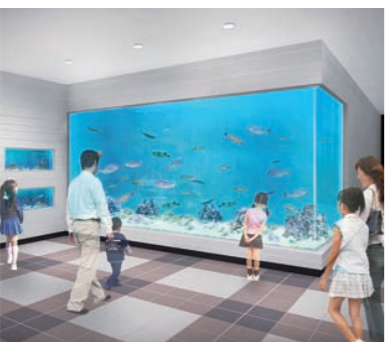
平成26年春にリニューアル(海浜自然センター)

来年7月から11月までの期間に記念イベントを集中実施します。リニューアルオープンする若狭歴史博物館(仮称)での特別展や、嶺南各地で魅力ある資源を活かした企画が数多く展開できるよう、地元市町、観光協会、経済団体等と準備を進めています。この機会を活かし、地域全体を盛り上げていきましょう。