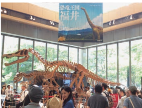
東京丸の内で大恐竜展を開催

8月には、JR東京駅で観光PRや特産品の販売による大型出向宣伝を実施。併せて、丸の内では大恐竜展、東京駅のレストランでは福井県産の厳選素材を使ったフェアなど、「恐竜」と「食」を集中的にPRしました。