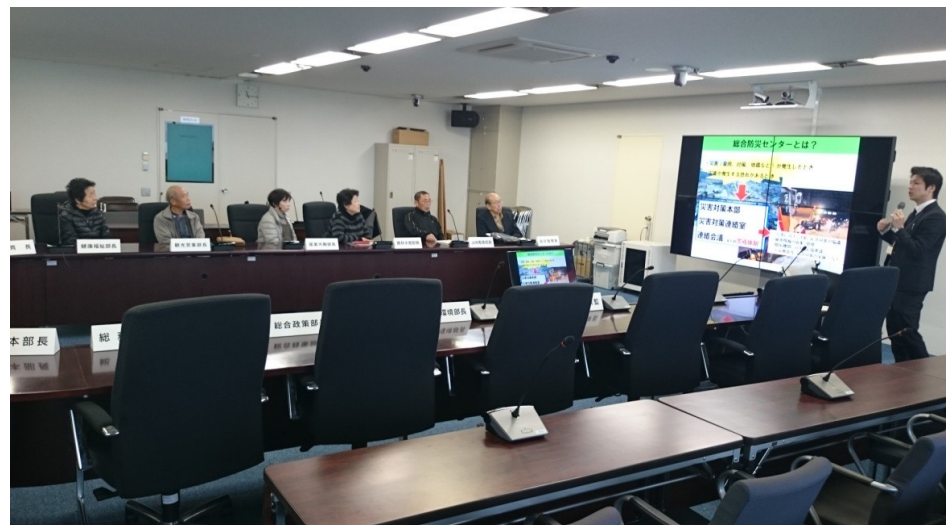
総合防災センター