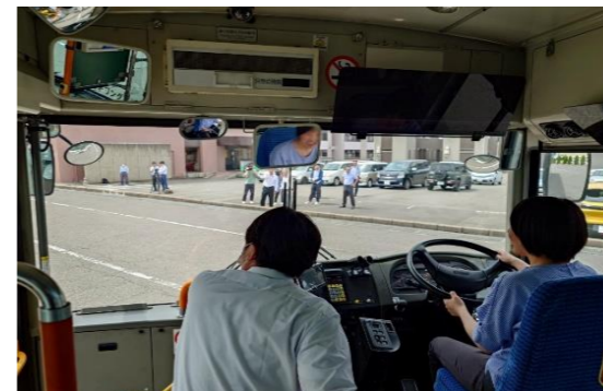
【大型二種免許の取得支援(イメージ)】