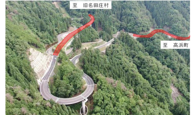
【坂本高浜線(おおい町石山)】