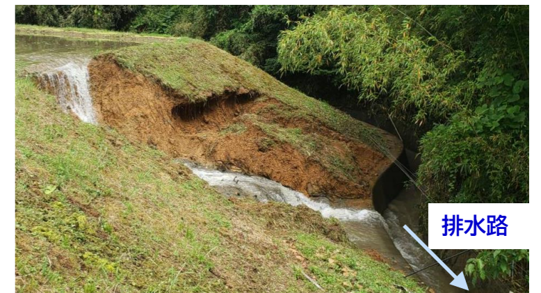
こうとうがはら 【越前市勾当原町】