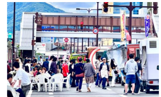
【消費喚起イベント(イメージ)】