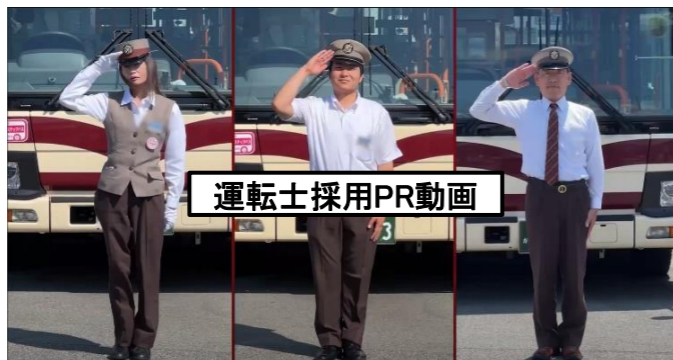
【運転士採用PR動画(イメージ)】