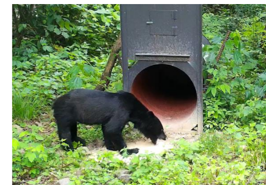
【ツキノワグマの捕獲(イメージ)】