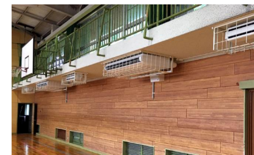
【固定式空調機器(イメージ)】