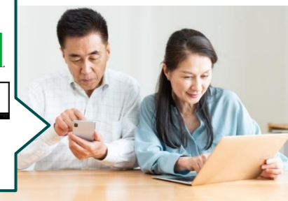
【親へのアドバイス(イメージ)】