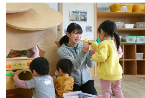
【こどもの成長を支える保育者(イメージ)】