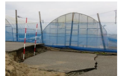
【地震により被災したハウス】

〔補助率：再整備 国1/2以内、県1/3（共済未加入の場合は、1/4） 撤去 国1/2以内、県1/3〕