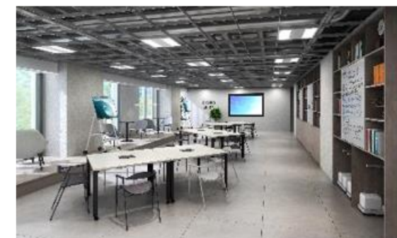
【ワークスペース(イメージ)】