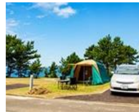
【オートキャンプ(イメージ)】