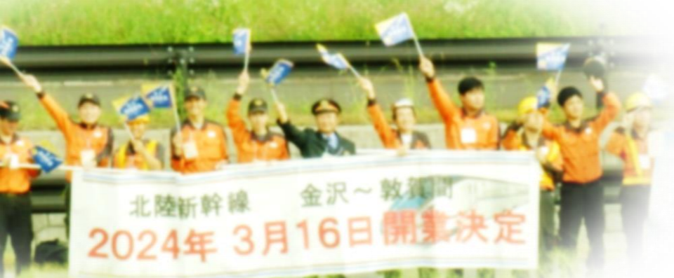
越前たけふ駅周辺