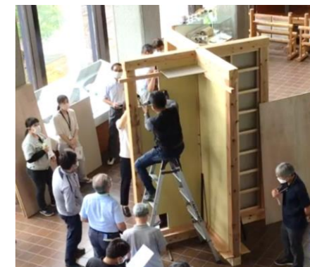
【低コスト工法講習会の様子】