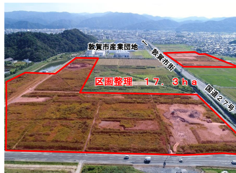
【ほ場整備 敦賀西部地区】462百万円