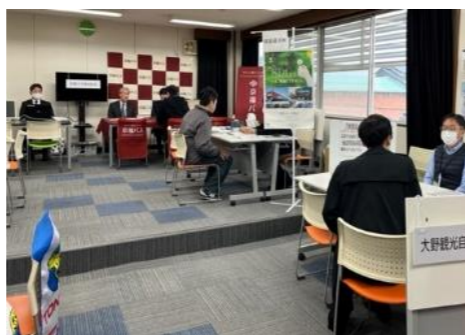
【会社説明会(イメージ)】