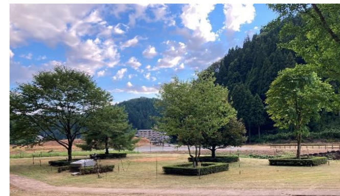
【会場：一乗谷朝倉氏遺跡】

開催日 令和6年10月19日(土)、20日(日) 会場 お手入れ行事 一乗谷朝倉氏遺跡 式典行事 サンドーム福井