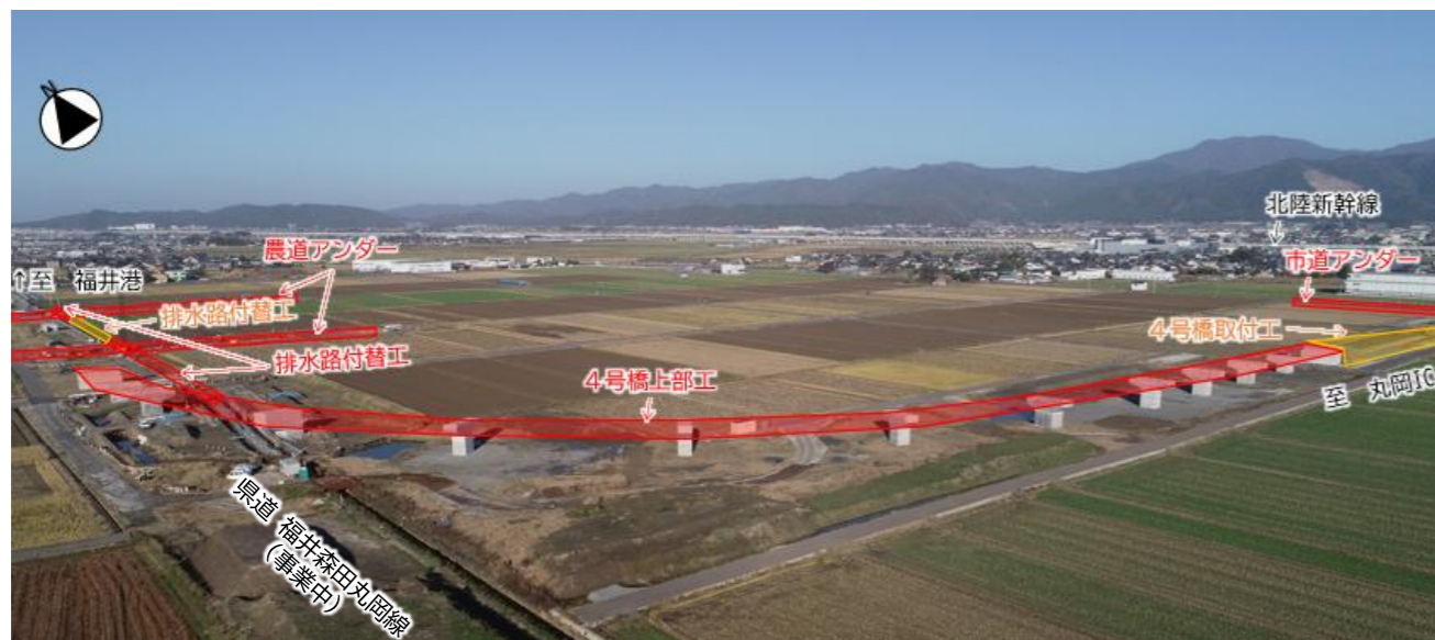
【福井港丸岡インター連絡道路】2,420百万円

道路・河川・砂防ダム・港湾の整備 等 ほ場・農業用施設・漁港・治山ダムの整備 等