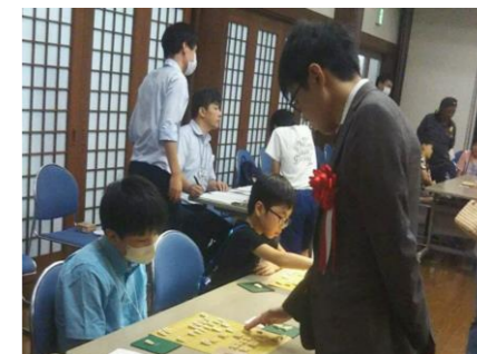
【将棋イベント(イメージ)】

対局にあわせ、県内の観光PR広告を掲載 プロ棋士との多面指し、朝倉象棋(しょうぎ)体験教室等を開催