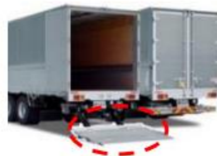
【荷役作業の省力化機器(イメージ)】