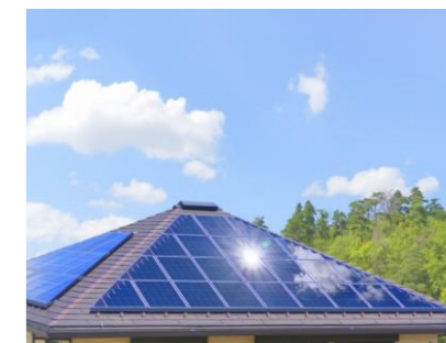
【太陽光発電(イメージ)】

太陽光と蓄電池のセット導入 補助上限額:60.5万円 太陽光の単独導入 補助上限額:25万円