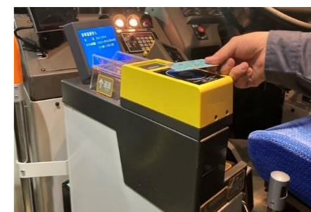
【バスの交通系ICカード】