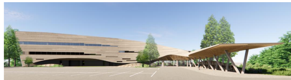
【新学部棟(イメージ)】