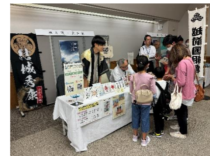
【お城イベント(イメージ)】

県内外の関係団体(自治体・観光協会・城郭管理団体等)によるブース出展 著名人による講演やトークセッション 県内各地のお城イベントとの連携開催(巡回バスの運行)