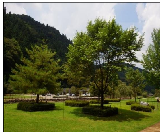
お手入れ行事会場 (一乗谷朝倉氏遺跡)