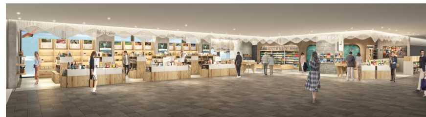
出店するアンテナショップのイメージ