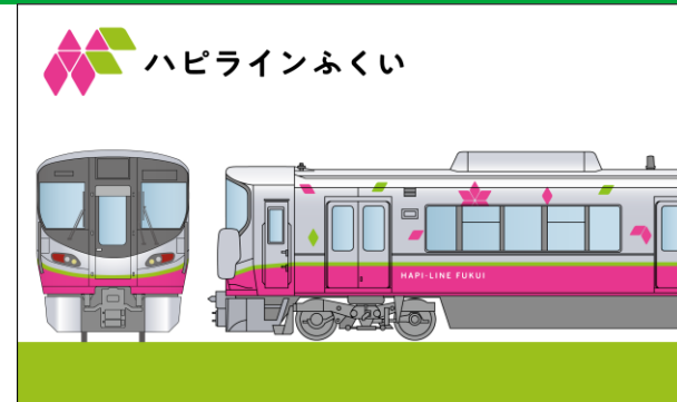
ハピラインふくいの車両デザイン