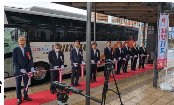
はぴバスの出発式