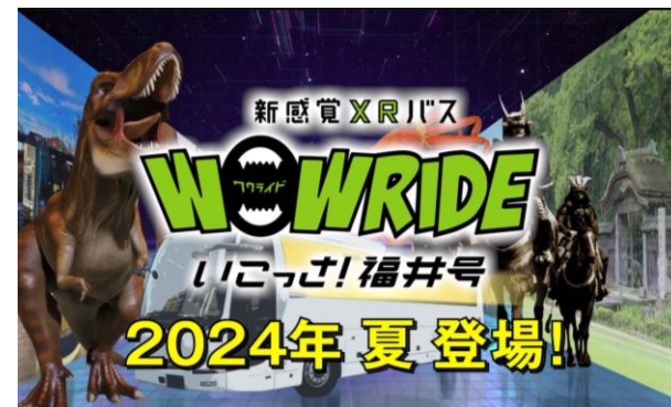
WOW RIDE いこっさ！福井号