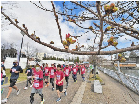
ふくい桜マラソン TRAIL RUN (プレ大会)の様子