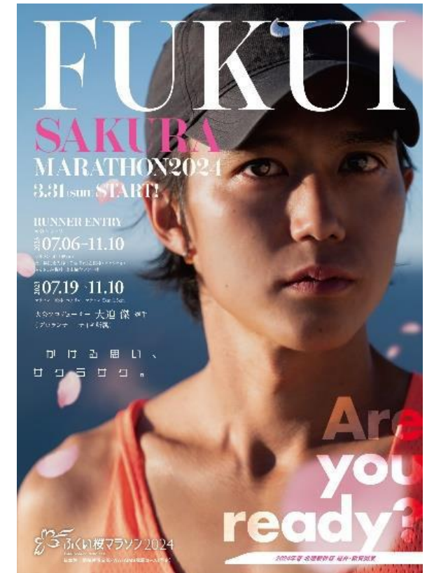
ふくい桜マラソンポスター