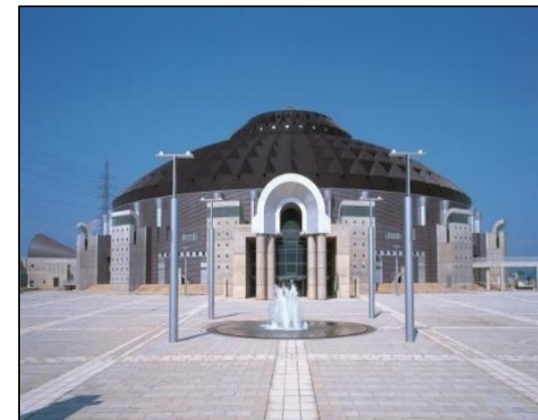
式典行事会場 (サンドーム福井)