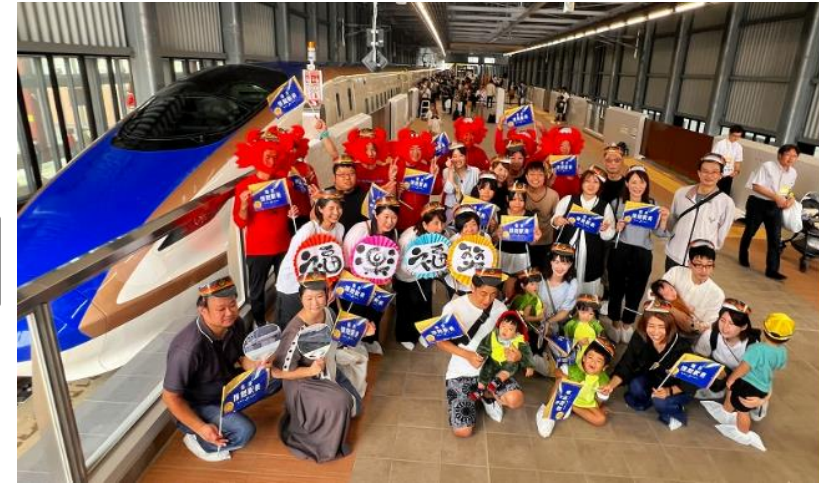
福井情熱駅長のCMの撮影風景

〔3月16日（土）、3月17日（日）、駅設置4市と周辺市町が連携し歓迎イベントを開催〕