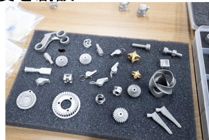
金属3Dプリンターで作製した造形物