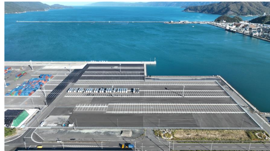
敦賀港（鞠山南地区）国際物流ターミナル 供用開始