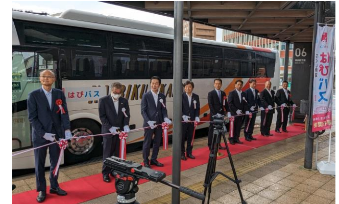
「はぴバス」テストツアー出発式

北陸新幹線の県内4駅を発着点に、大本山永平寺や 一乗谷朝倉氏遺跡など県内主要観光地を周遊する 6コースのテストツアーを実施