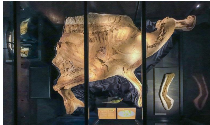
日本初となる 全身ミイラ化石の大型展示