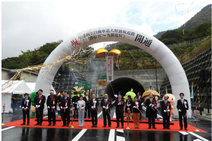
中部縦貫自動車道 勝原IC～九頭竜IC開通