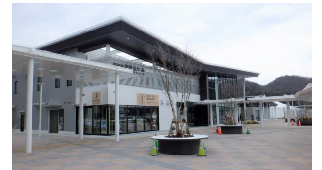
道の駅 越前たけふ