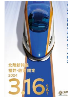
開業日をPRするポスター