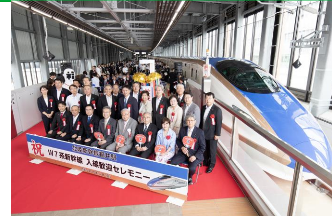
W7系新幹線 入線歓迎セレモニー（福井駅）