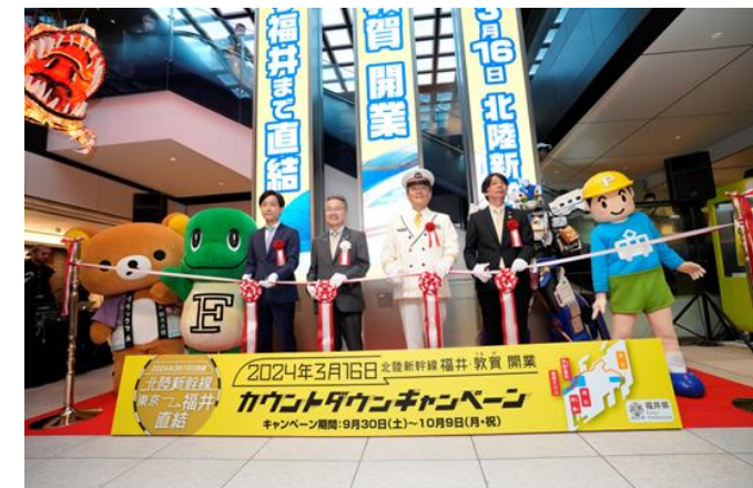
開業カウントダウンキャンペーン（東京駅）