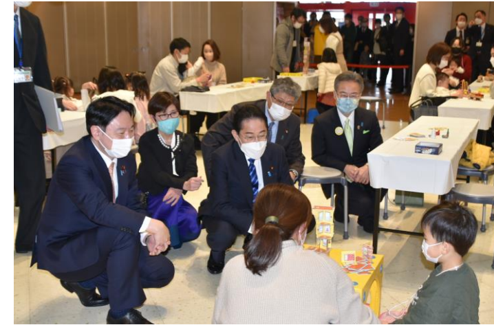
第一弾の「こども政策対話」で岸田首相が福井県を訪問（2月）