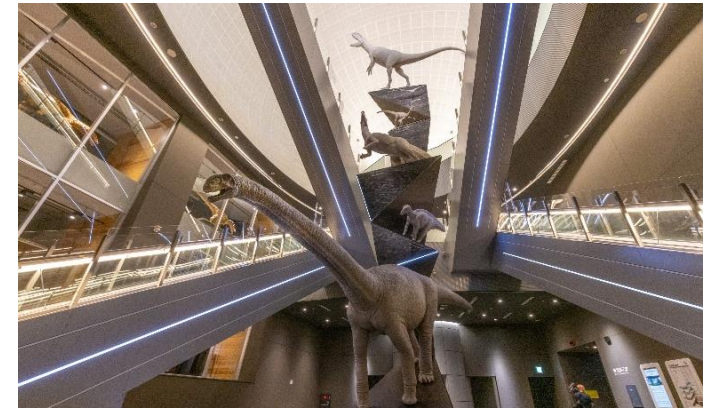
小タマゴホール内モニュメント