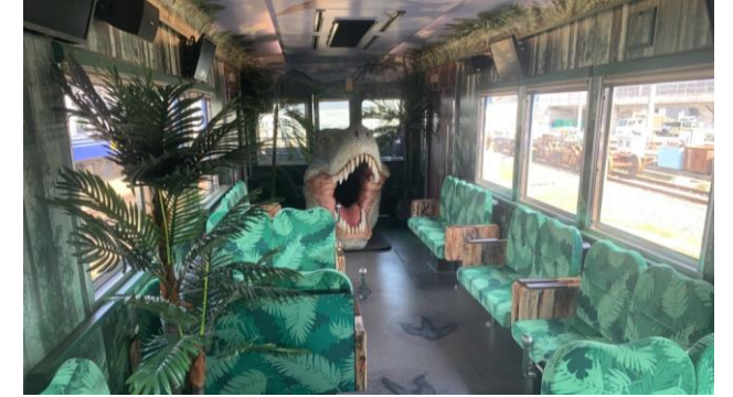
えちぜん鉄道「恐竜列車」

福井駅と恐竜博物館最寄りの勝山駅を結ぶ恐竜専用列車 車内には恐竜モニュメントや「恐竜アテンダント」