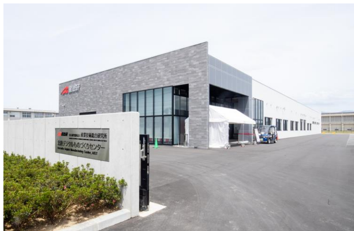
北陸デジタルものづくりセンター