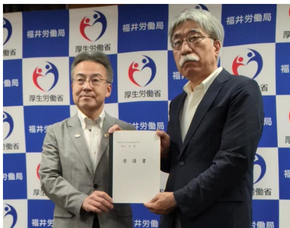
福井地方最低賃金審議会への要請