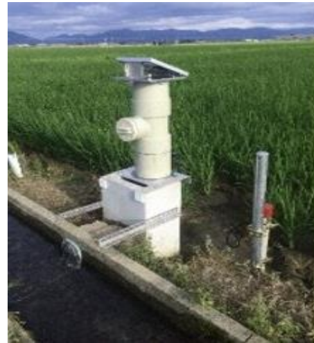
【自動給水栓(イメージ)】