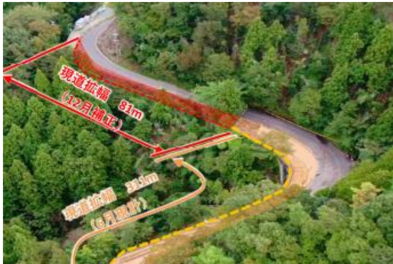
【坂本高浜線(おおい町石山)】 (現道拡幅)