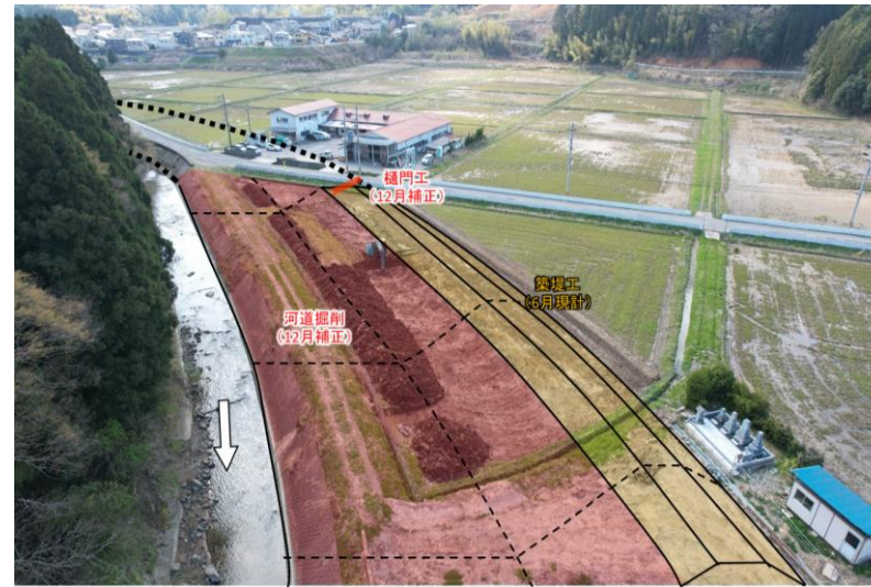
【七瀬川(福井市内山梨子町～大年町)】 (河道掘削)