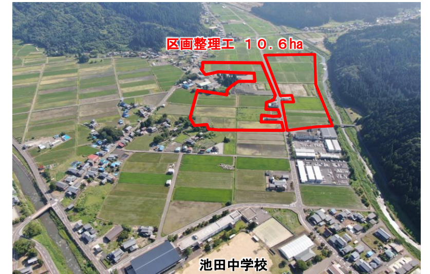
【区画整理工(池田町)】 (経営体育成基盤整備事業)