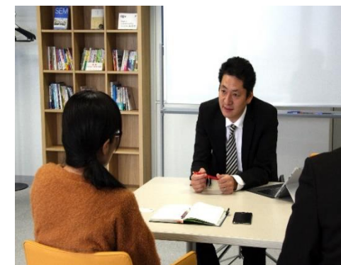
【専門家相談(イメージ)】

「取引適正化サポーター(中小企業診断士など)」の派遣などにより、 県内全域で価格交渉・価格転嫁を促進