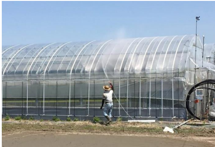
【遮熱剤散布(イメージ)】