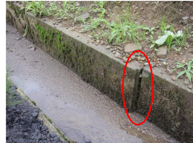
【漏水している農業用用水路】