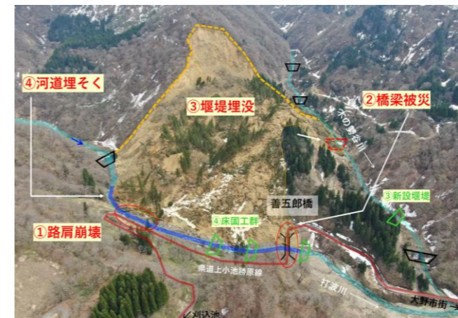
【令和5年3月融雪被害(大野市)】