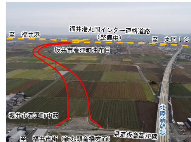
【福井森田丸岡線(坂井市工区)】