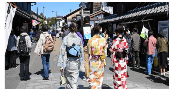
【まち歩きの様子(イメージ)】

歩道の石畳化や建物の外観改修による景観整備など 観光地域のさらなる磨き上げに対し支援