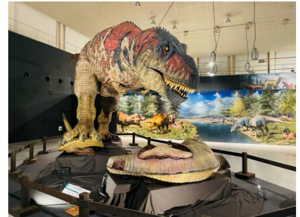
【恐竜展の様子(イメージ)】