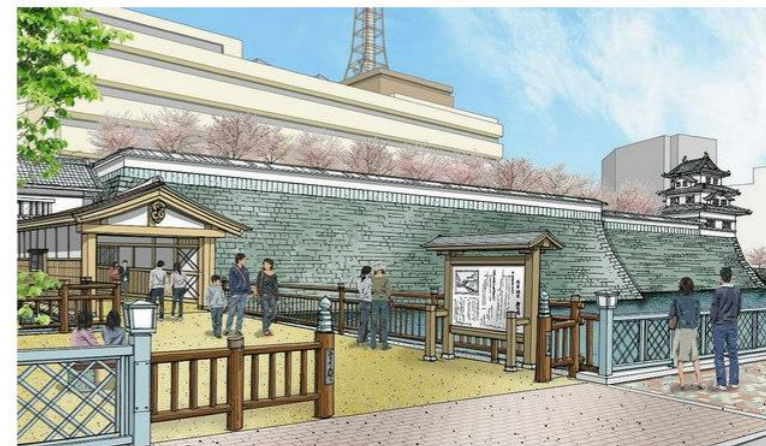
【福井城址西側から見た坤櫓と土塀の復元整備(イメージ)】