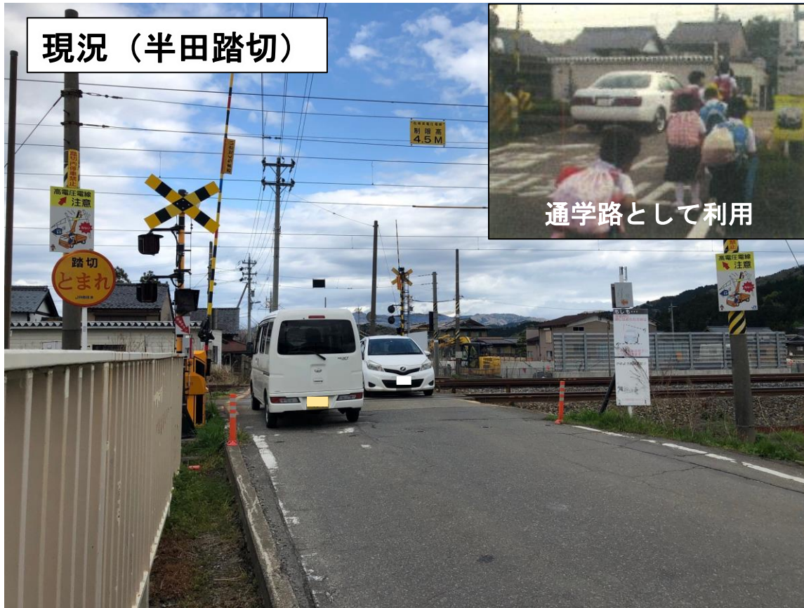
踏切の道幅が狭く、歩道がない（幅 5 m）