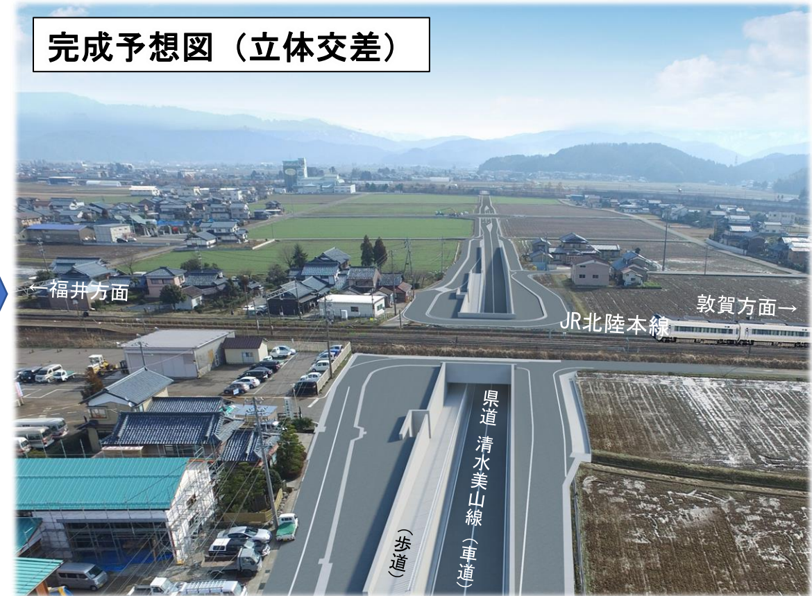
立体交差（アンダーパス） [歩道あり] （幅：車道部 8 m、歩道 3 m）