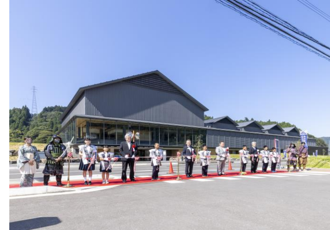
開館セレモニーの様子