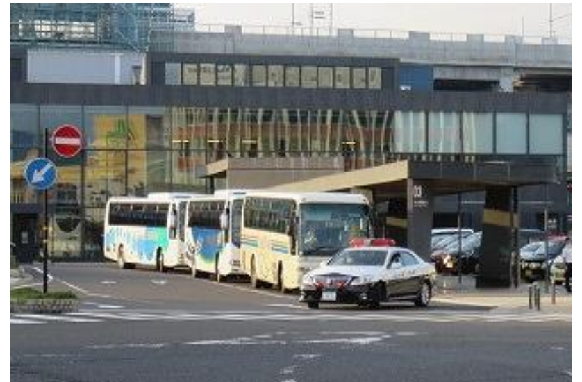
災害時緊急バスの運行