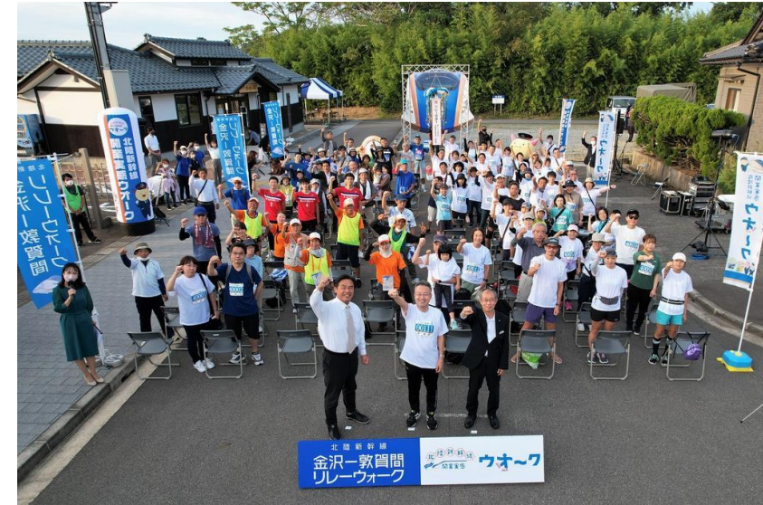
リレーウォーク完走セレモニー