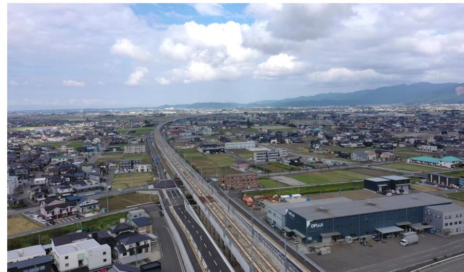
新幹線レールの様子