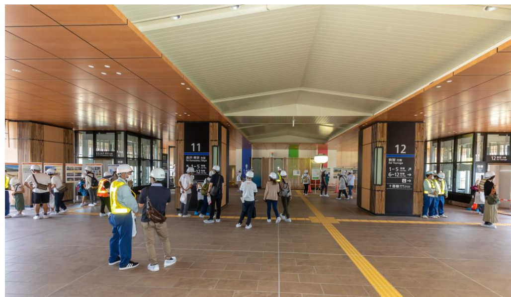
芦原温泉駅駅舎見学の様子