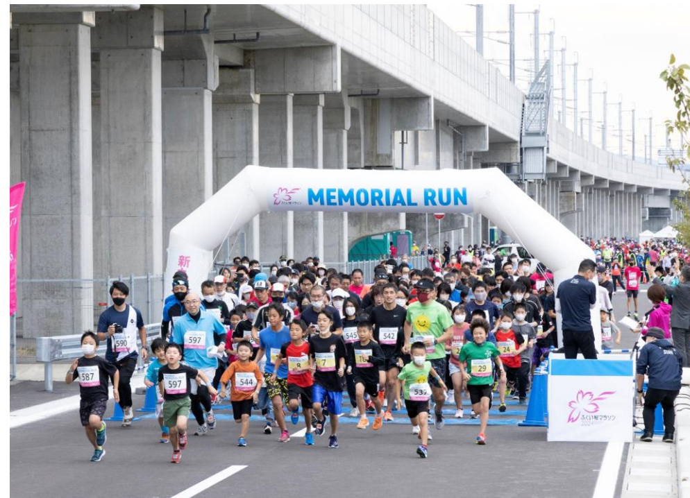
新九頭竜橋開通メモリアルランの様子