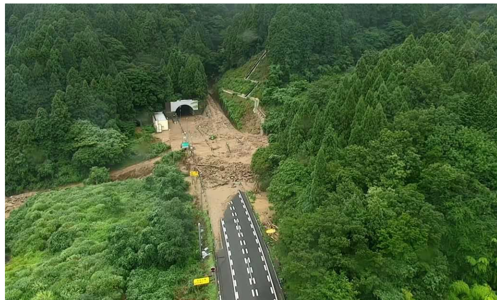
北陸自動車道での土砂災害の様子