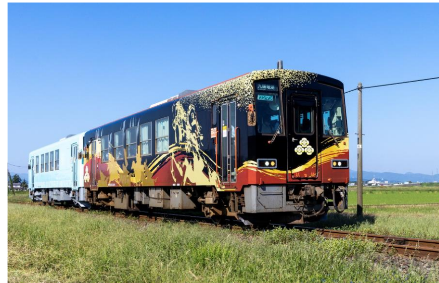
JR越美北線「戦国列車」