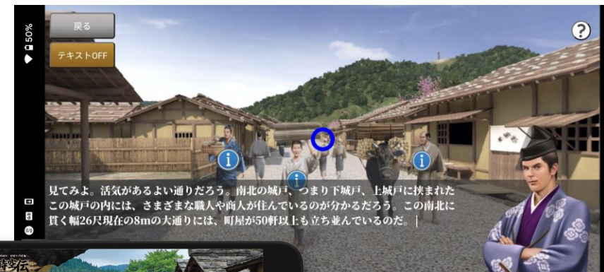
アプリ「戦国時空伝」