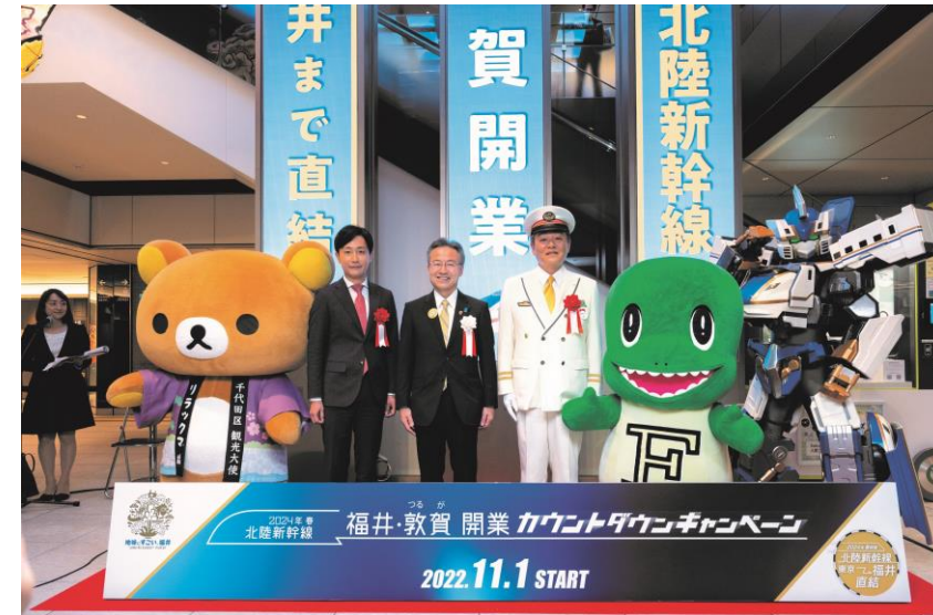
カウントダウンキャンペーン