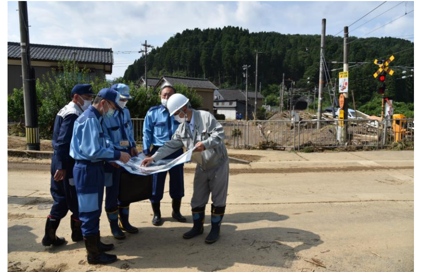
被災地での視察の様子