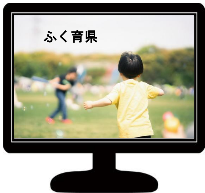
【テレビCMの実施（イメージ）】