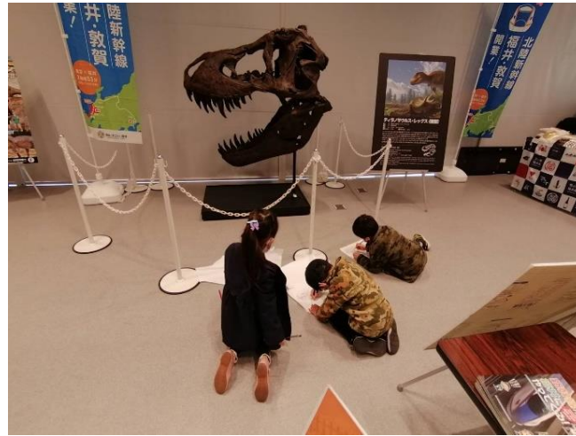
【イベント（イメージ）】