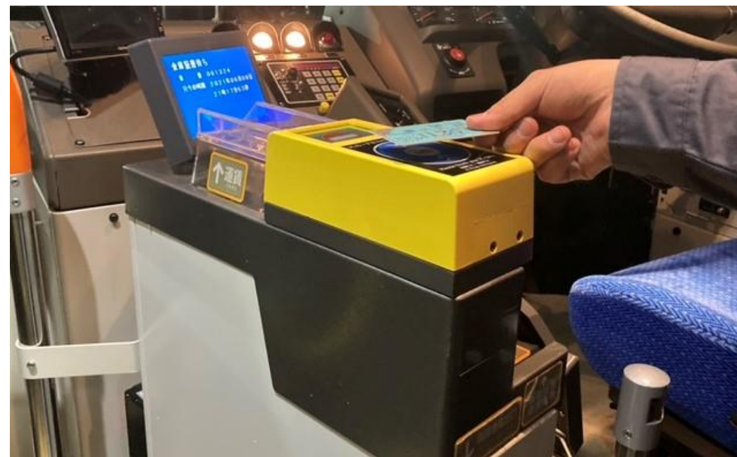
【交通系ICカードの利用イメージ】