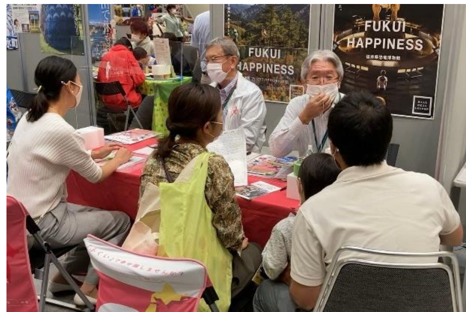
【移住相談イベント等の開催（イメージ）】