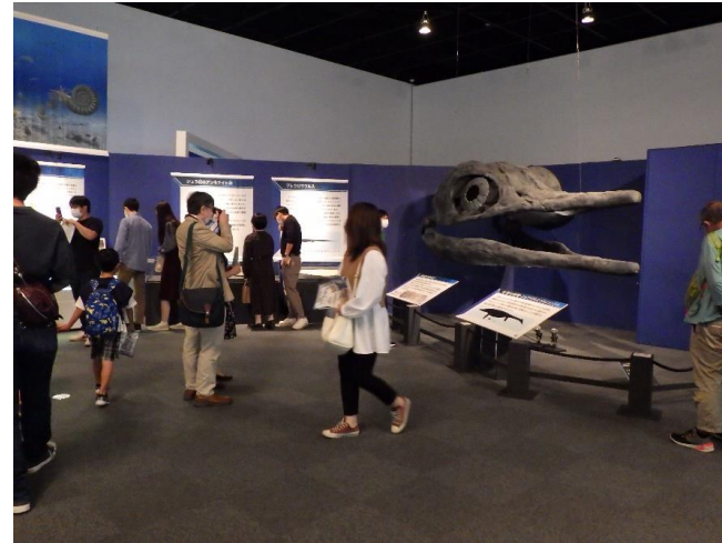
【恐竜博物館 令和3年度特別展】