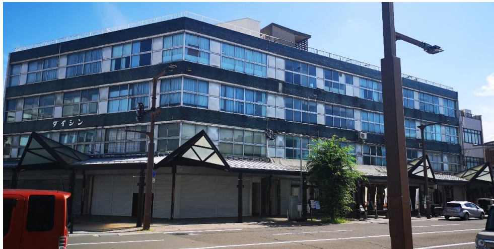
【神楽町1丁目商店街】