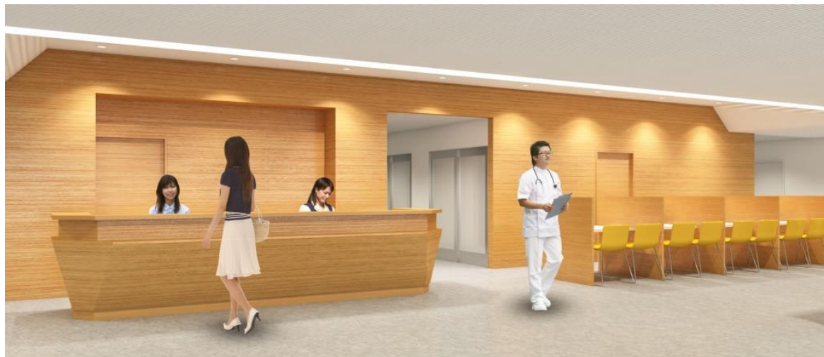
【患者総合支援センター(イメージ)】