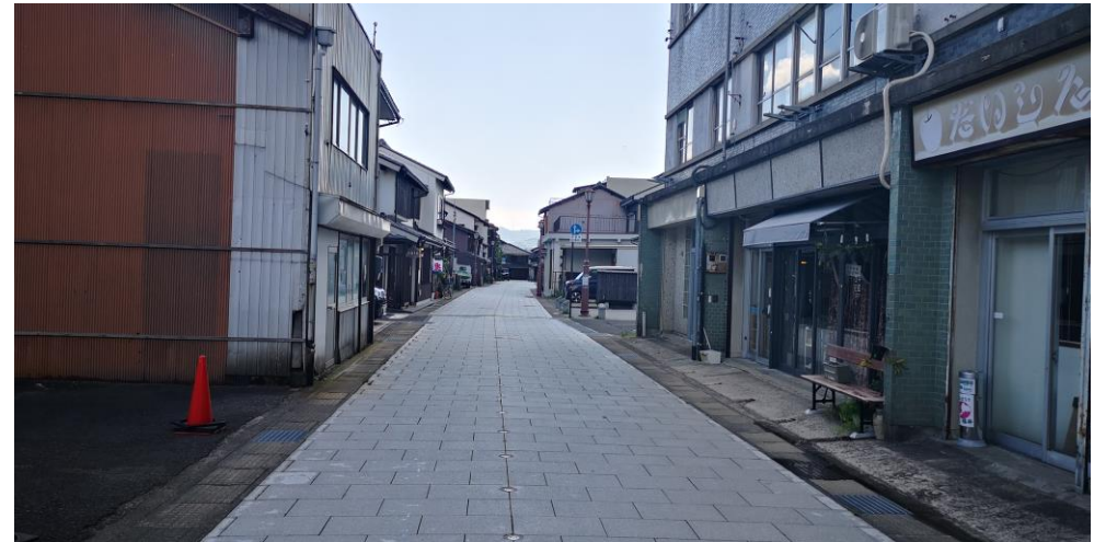
【博物館通り商店街】