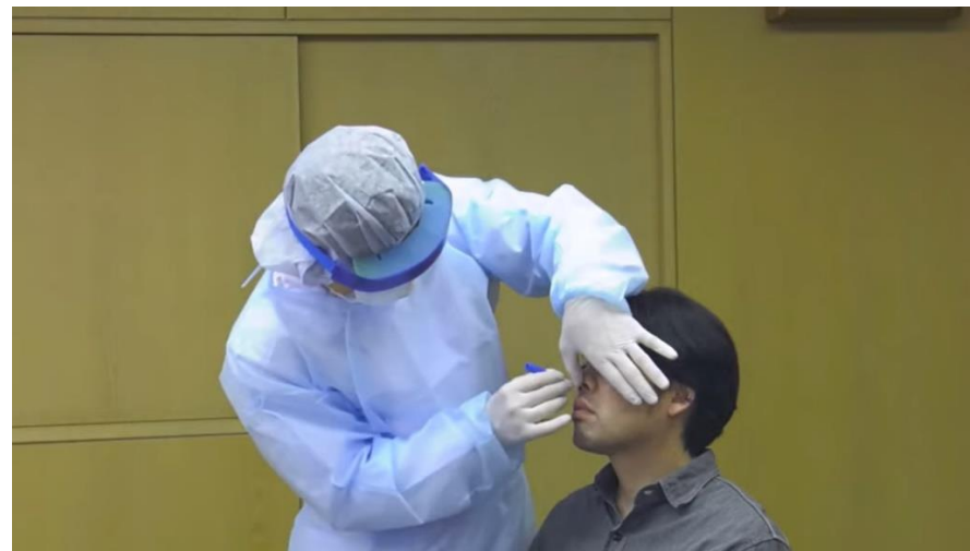
【発熱外来(イメージ)】