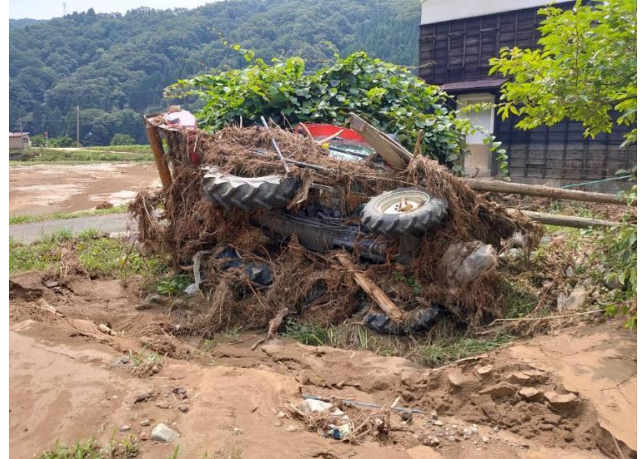
【被害を受けた農業用機械】