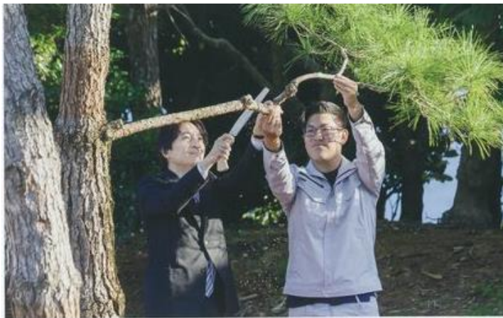
お手入れ行事（令和元年 沖縄県）

全国植樹祭において天皇皇后両陛下がお手植えされた樹木について、皇族殿下が枝打ち、施肥などのお手入れを行う行事