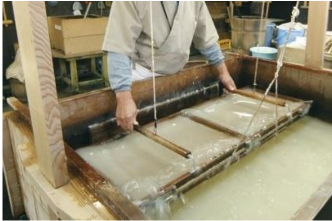
【越前和紙製作風景 (イメージ)】