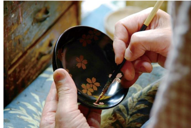
【越前漆器製作風景 (イメージ)】