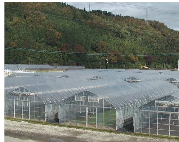
【施設園芸用ビニールハウス】