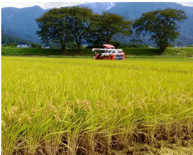
【福井県産米の収穫風景】

(補助対象 肥料等価格の高騰分、施設園芸用ハウスビニール張替に係る資材高騰分 等)