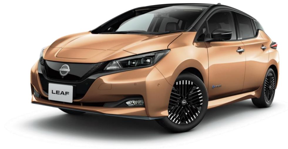
【電気自動車（イメージ）】