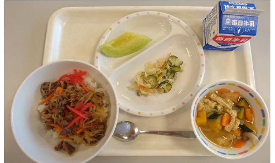
【学校給食 (イメージ)】