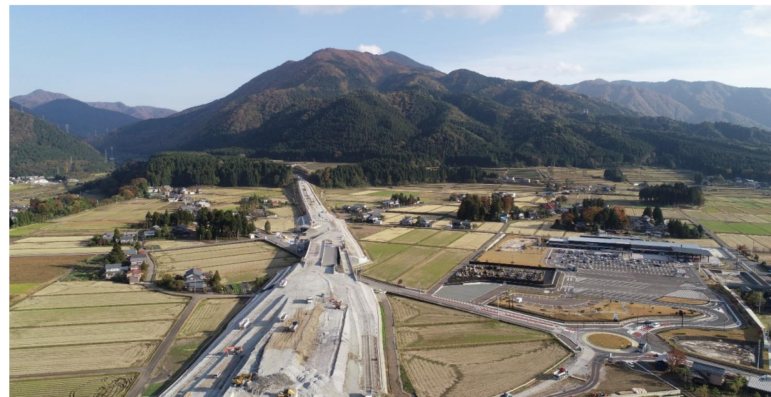
整備が進む中部縦貫自動車道（大野東IC（仮称）付近）