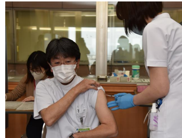
新型コロナワクチン接種