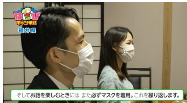
「おはなしはマスク」を呼びかける県作成CM