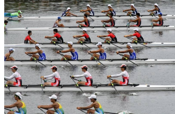
久々子湖でのボート競技