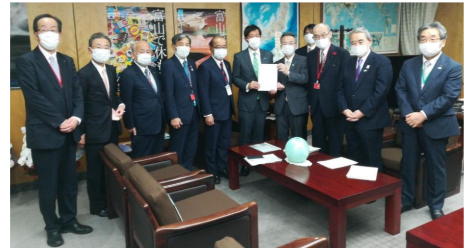
同盟会会長として初の国への要請活動 （11月9日）