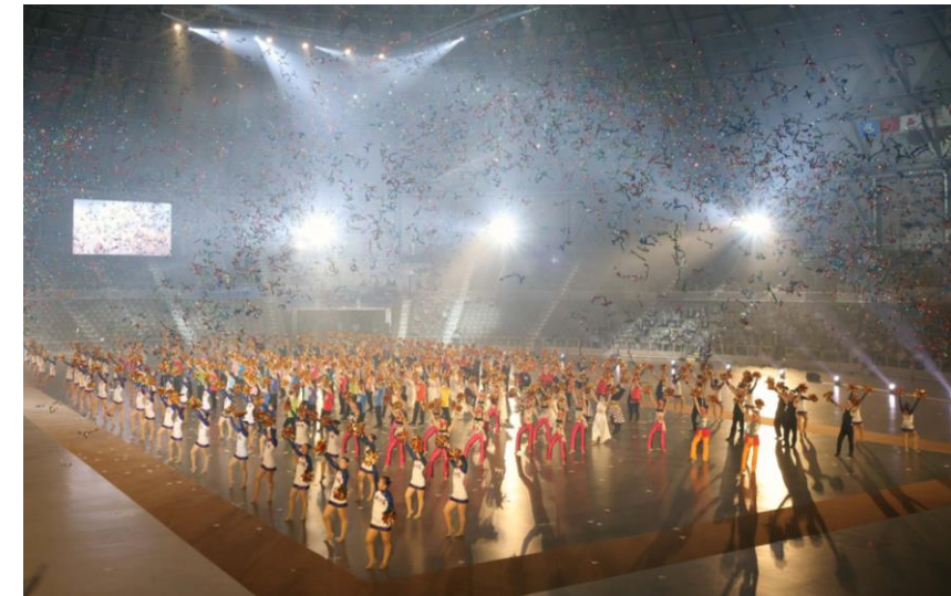
総合開会式での歓迎演技（8月13日）