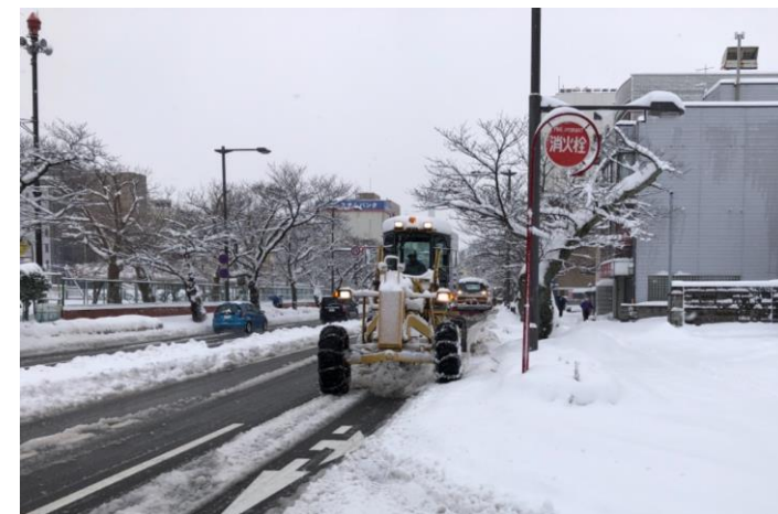
令和3年1月大雪時の除雪の様子