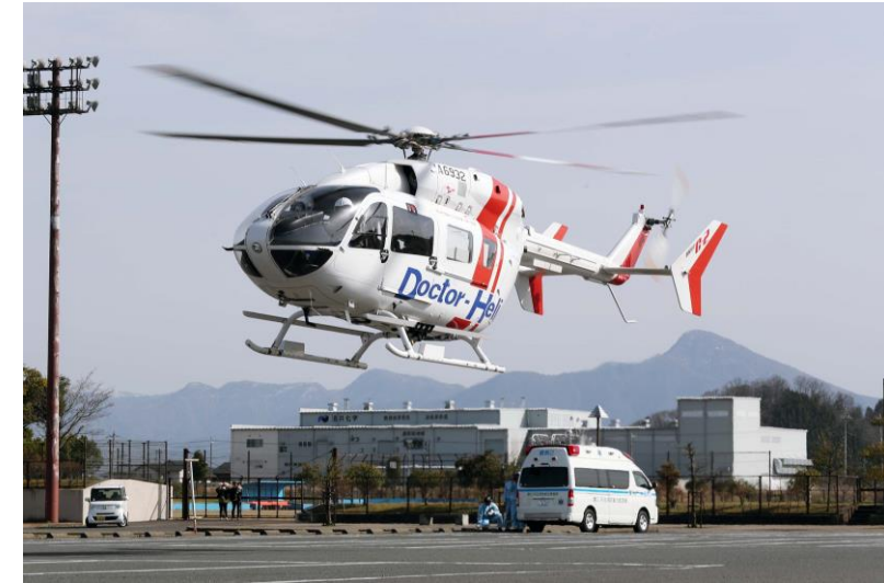
5月24日に運航を開始したドクターヘリ