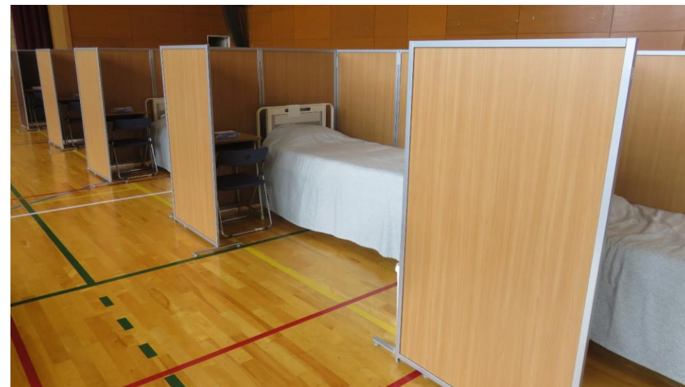
軽症者用の臨時医療施設として準備された体育館