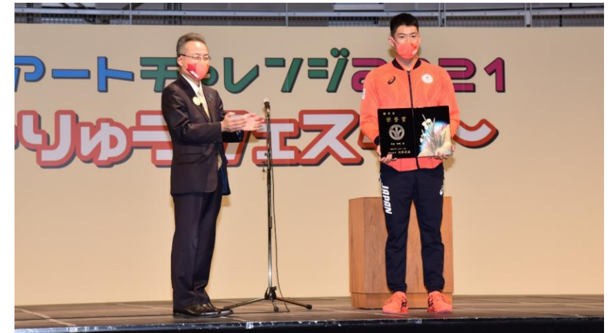
見延選手への県栄誉賞贈呈式（12月11日）