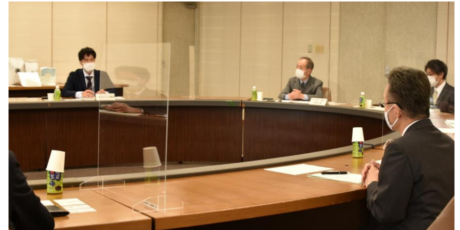
雇用シェアについて企業代表者との意見交換 (2月4日)