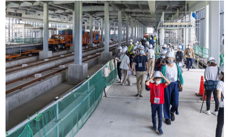
新幹線駅舎（越前たけふ）現場見学会 （9月19日）