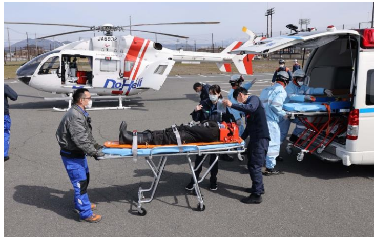
運航開始を前に患者搬送手順を確認した訓練（3月19日）