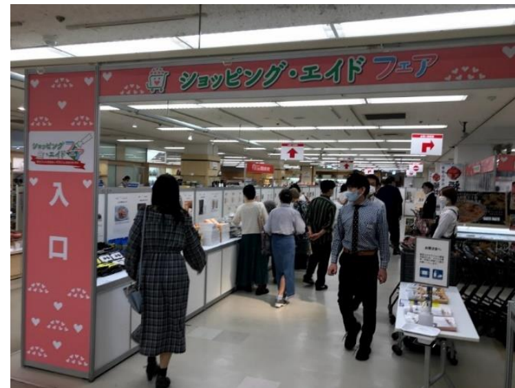
【消費喚起キャンペーンのイメージ】