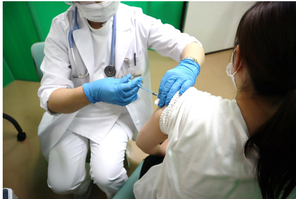
【医療機関におけるワクチン接種】