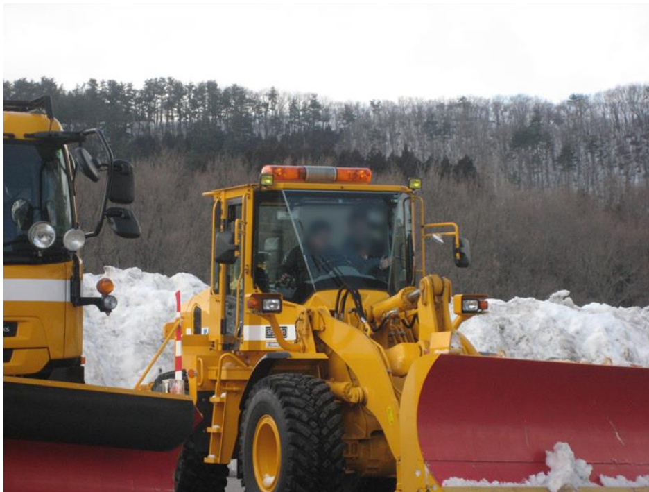
【除雪オペレータの講習状況】