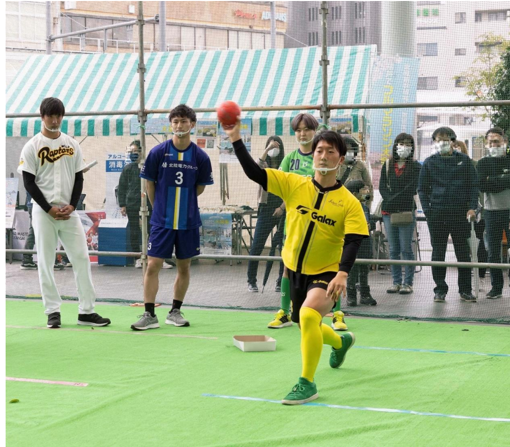
【例：ハピテラスでのFUKUI RAYS交流活動】