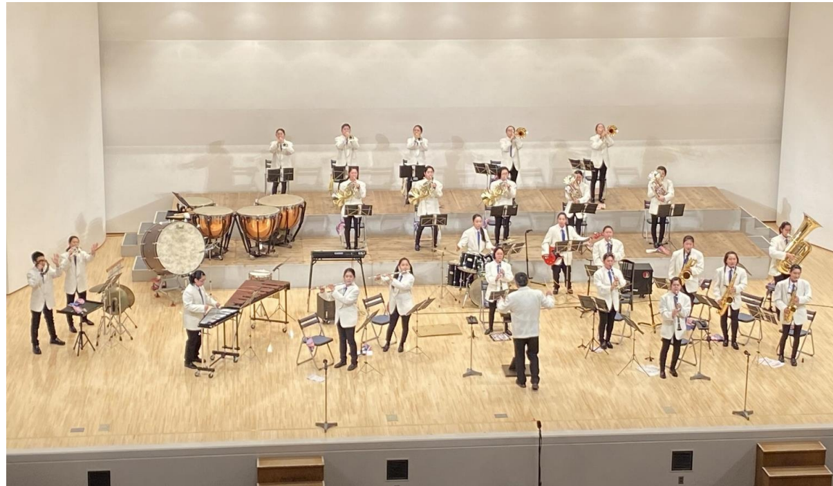
【文化ホールでの演奏（イメージ）】