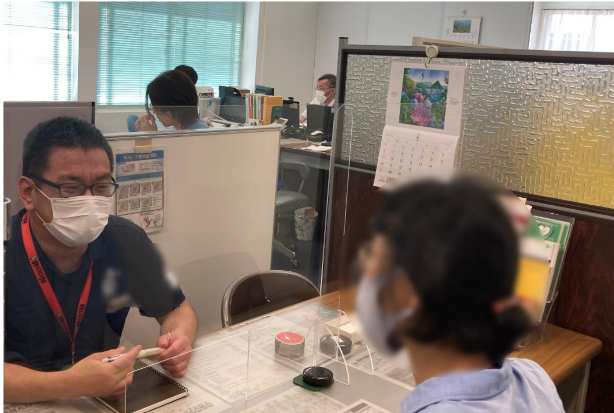
【相談受付イメージ】