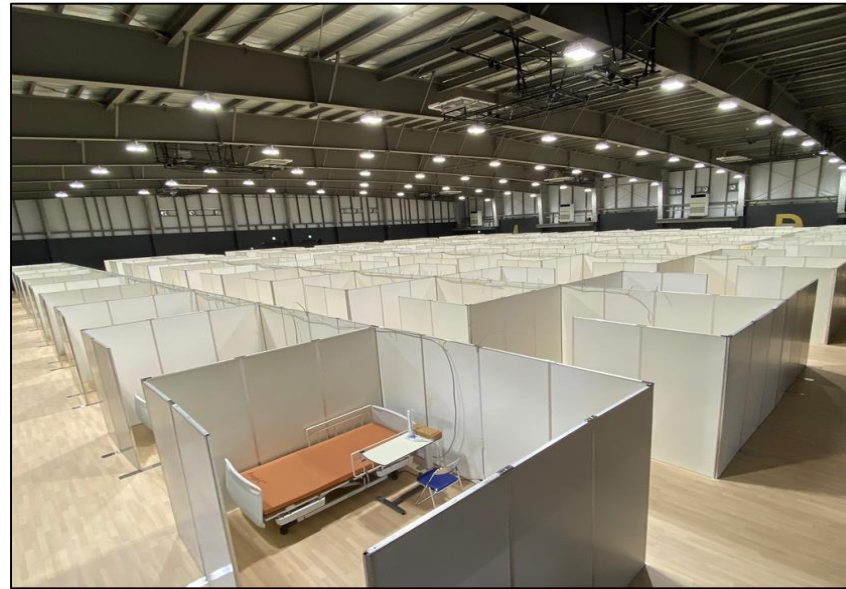
【臨時医療施設イメージ】