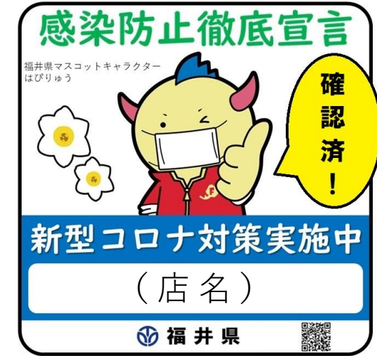
「感染防止徹底宣言」ステッカー