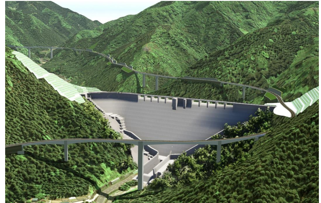
足羽川ダム（完成イメージ）