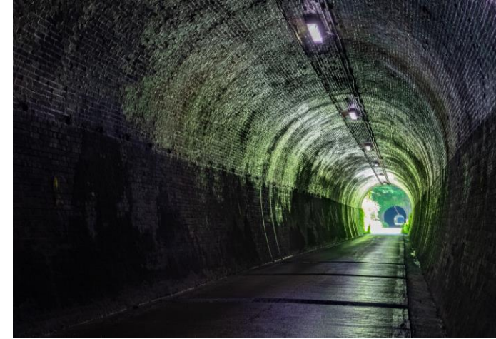
旧北陸線トンネル群