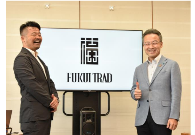
BEAMSとの合同記者会見