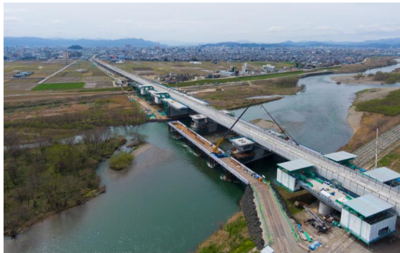
北陸新幹線 九頭竜川橋りょう