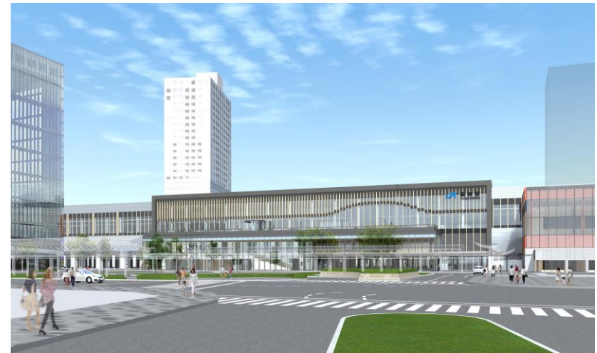
福井駅 駅舎デザイン