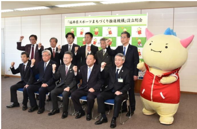
福井県スポーツまちづくり推進機構 設立