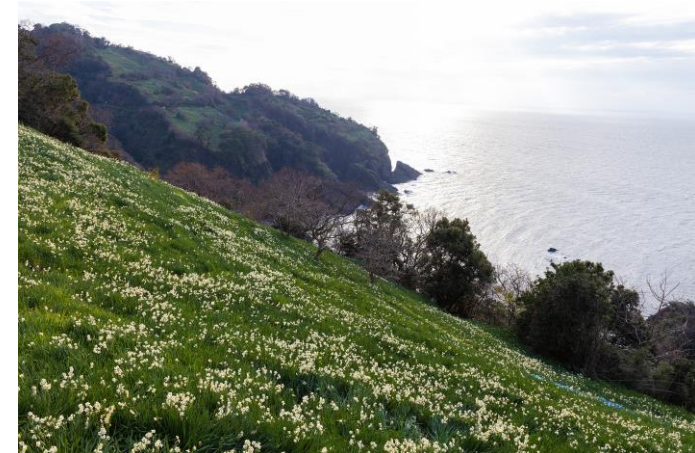
越前海岸の水仙畑