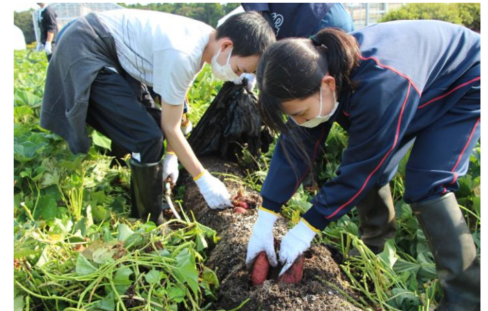
県立大学「創造農学科」の実習風景