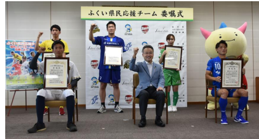
ふくい県民応援チーム 委嘱式