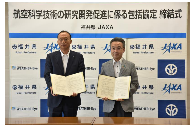
JAXAとの包括協定締結式