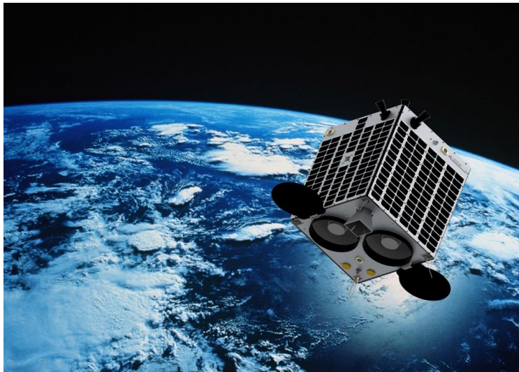
県民衛星「すいせん」