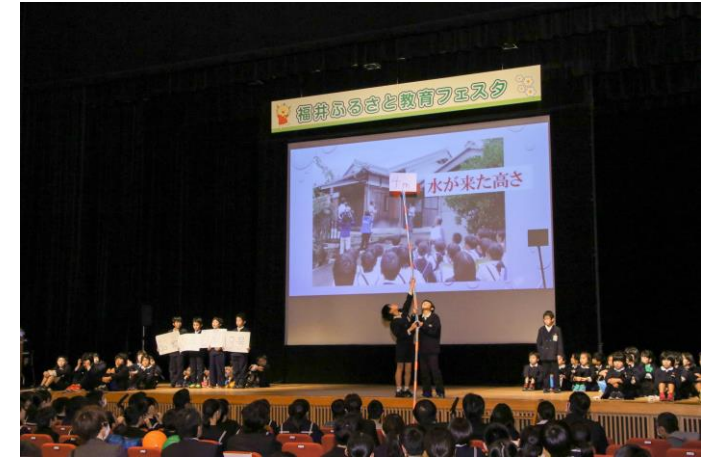
ふるさと教育フェスタ