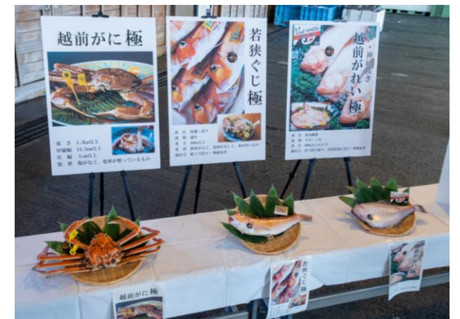
「極」シリーズ（越前がに、若狭ぐじ、若狭がれい）