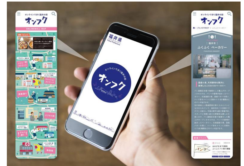
ポータルサイト「オンフク」