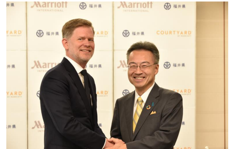
マリオット・インターナショナルとの合同記者会見