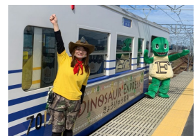
きょうりゅう電車出発