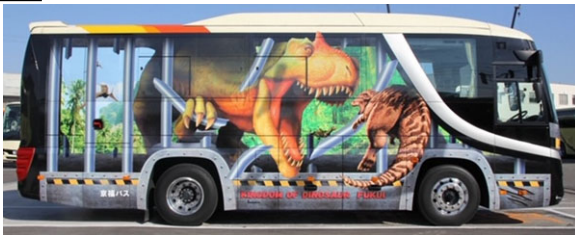
恐竜バスラッピング