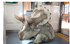
恐竜モニュメント