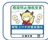
感染防止徹底宣言店