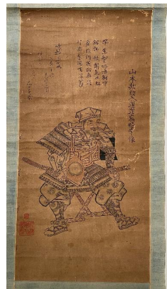
山本勘助入道道鬼晴幸像