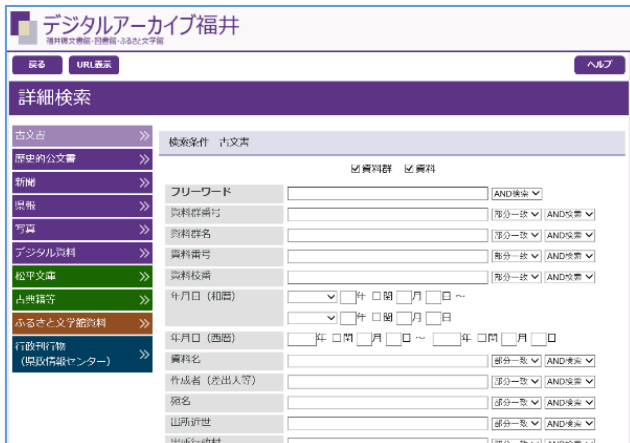
「デジタルアーカイブ福井」検索画面