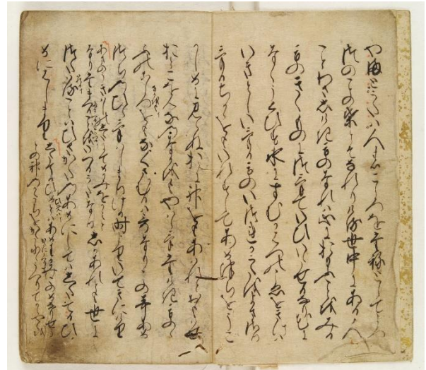
越前文庫「古今和歌集」仮名序 室町時代の古写本