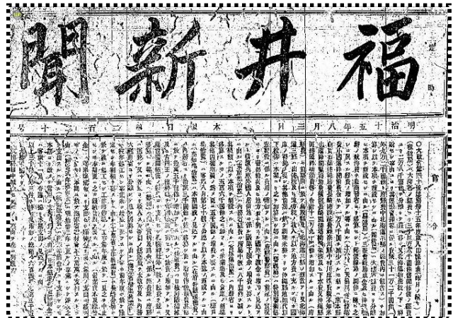
明治期新聞画像 明治15年(1882)8月3日号…最初期のもの