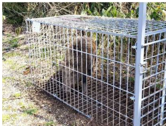
【野生イノシシの捕獲】