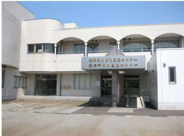
【こども急患センター(福井市城東)】