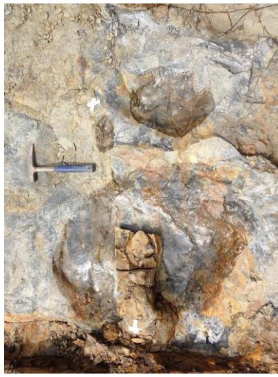
【竜脚類の足印（上位層）】