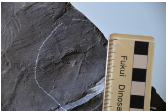
【翼竜の前足の足印】

北谷層の翼竜の足印化石は2010年に新種として報告されており、今回の足印化石も同種と考えられるが、前回報告された足印の追加記録として、当時の福井にいた翼竜の生態を知る上で重要な標本である。