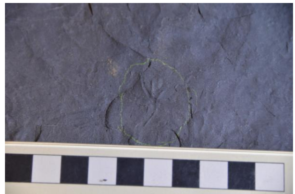
【翼竜の後足の足印】