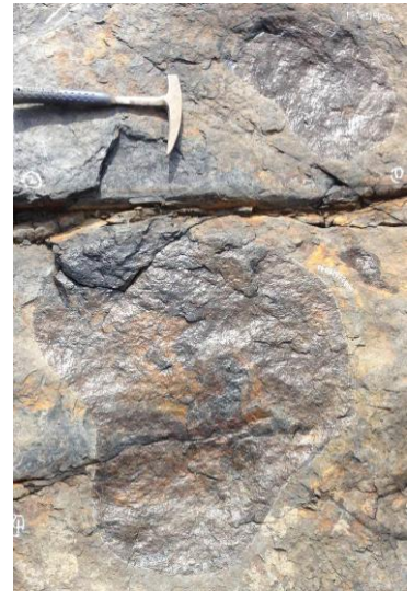
【竜脚類の足印（下位層）】

大きさ(長さ×幅 cm) 28.5×23.9 前足:28.6×43.6 後足:63.8×84.2 前足:22.2×34.6 後足:62.4×54.7