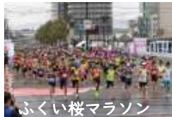
ふくい桜マラソン