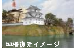
坤櫓復元イメージ