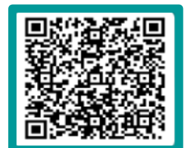
《お申込み QR コード》