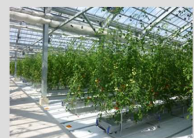
低廉な電力供給を活かした周年型大規模園芸施設・植物工場