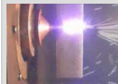
エネルギー研究開発拠点として培われたレーザー技術の産業分野への応用展開