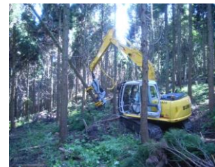
高性能林業機械の導入 (ハーベスタ)