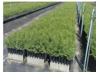
苗木供給体制の整備 (コンテナ苗)