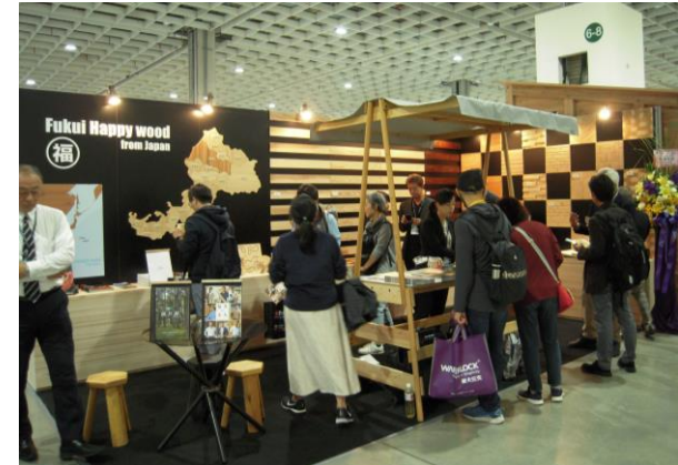
海外展示会への出展（台湾）