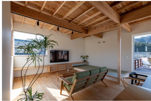
住宅での利用推進