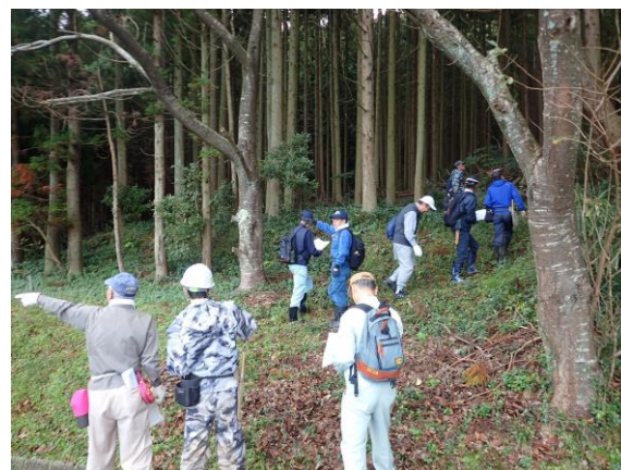
境界の明確化 (小浜市田鳥)