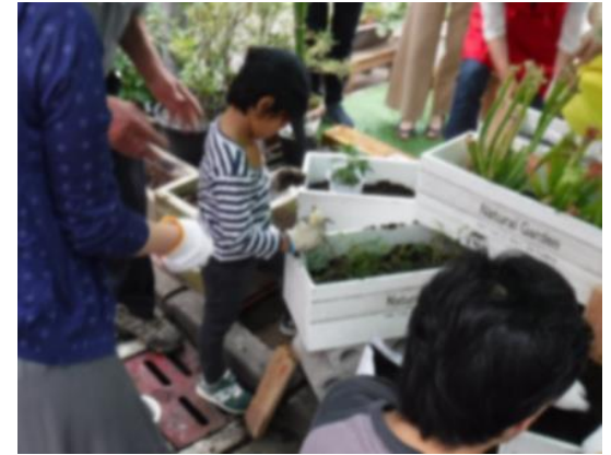
身近な景観づくり (福井駅周辺)