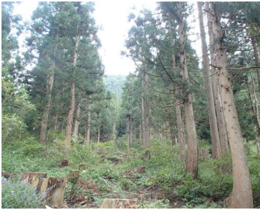
列状間伐 (勝山市木根橋)