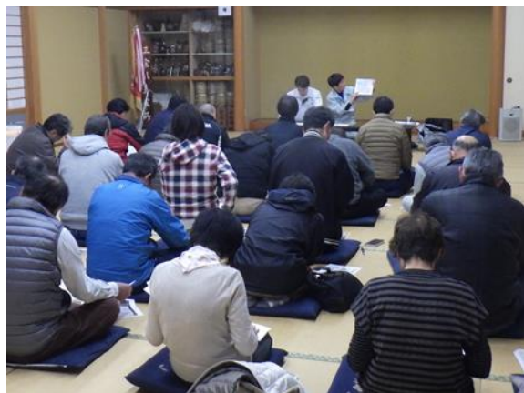
コミュニティ林業 集落説明会 (若狭町三宅)