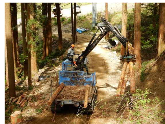
林業カレッジ研修 (大野市角野)