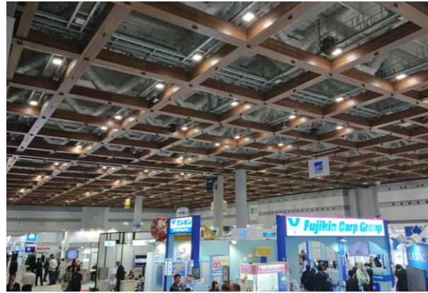
東京ビッグサイト（東京都）