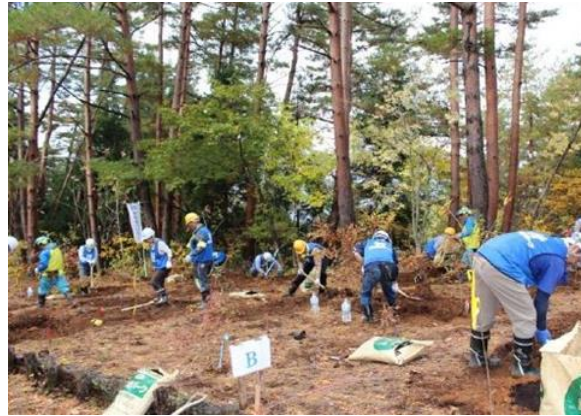
企業の森による広葉樹の植栽 (北陸電力グループ勝山雁が原の森)