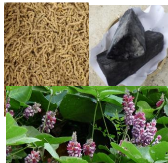
越前オウレン・研磨炭・ 熊川くず