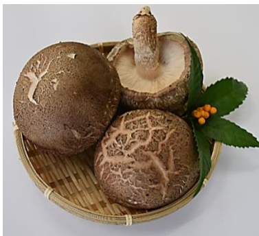
香福茸 (ジャンボしいたけ)