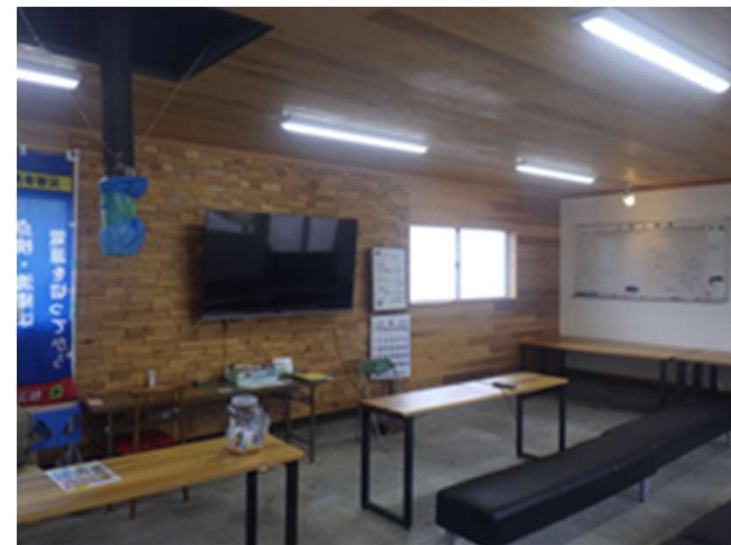
事務所内装の木質化