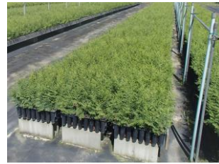
苗木供給体制の整備 (コンテナ苗)