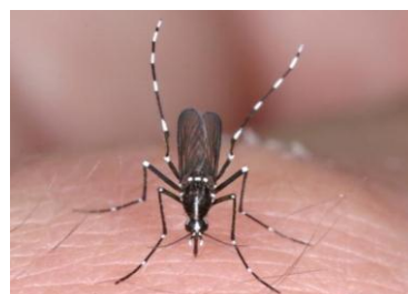
図 1 ヒトスジシマカの成虫

前述のように、デングウイルスとチクングニアウイルスは、主にネッタイシマカとヒトスジシマカによって媒介される。ネッタイシマカは、かつては沖縄や小笠原諸島に生息し、熊本県牛深町では 1944～1947年に一時的に生息したことが記録されている。当時のデング熱の国内流行にネッタイシマカが関与した可能性が示唆されたが、1955年以降は国内での採集記録がない。現在、ネッタイシマカは国内には生息していないと考えられているが、近年、国際空港のターミナルビル周辺や貨物便の機内で発見される事例が相次いでいる。