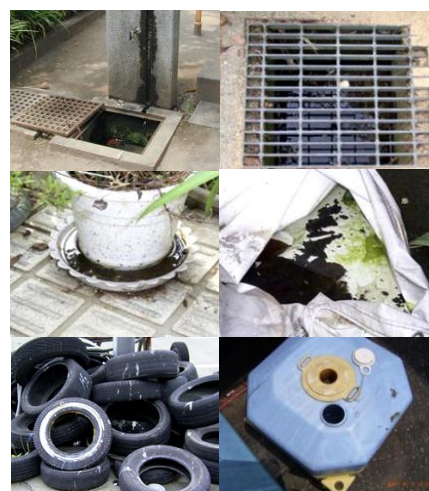
図3 幼虫の典型的な発生源

ヒトスジシマカの幼虫は比較的小さい容器に発生する。住宅地では雨水マス、植木鉢やプランターの水の受け皿、庭先に置き忘れたバケツや壺、コンビニ弁当などのプラスチック容器、古タイヤなどが発生源となる。また、雨を除けるために被せたビニールシートの窪みや、隙間にたまった水、廃棄された機械のフレームにたまった水などにも幼虫が発生する(図3)。一般にヤブカ属の卵は乾燥に強く、ヒトスジシマカの卵は数ヶ月の乾燥に遭遇しても、いったん水に浸ると孵化してくる。