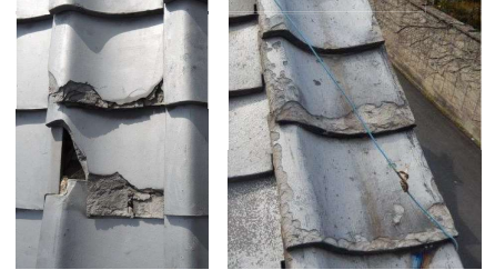
瓦が著しく破損している例