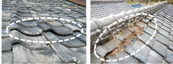
瓦に浮き上がりが生じている