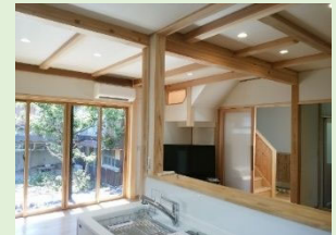
県産材を活用した長期優良住宅の例