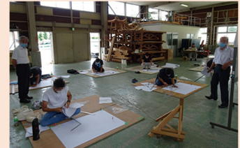
「ふくい棟梁講座」の実施状況