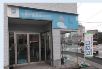
福井県セーフティネット賃貸住宅協力店