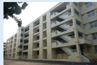
県営住宅の全面的な改修事例