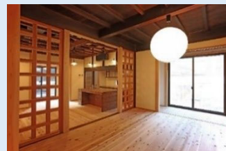
伝統耐震診断・伝統構法の耐震改修事例