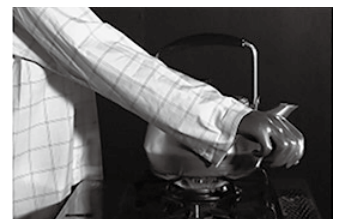
日に直接触れていないが そで口に着火

ろうそくの火が灯った状態で、仏壇周りで手を伸ばすような動作により着衣着火する事故が発生。