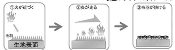
▼表面フラッシュ (イメージ)

万が一、着衣着火が起きたら、脱ぐ・叩く・水をかけるなどして早急に消火してください。やけどを負った場合はすぐに水で冷やし、医療機関を受診してください。