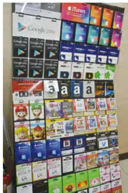
▲コンビニで売られている電子マネー（サーバ型プリペイドカード）の例