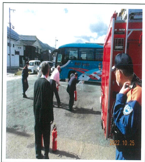
消火器訓練を行った。