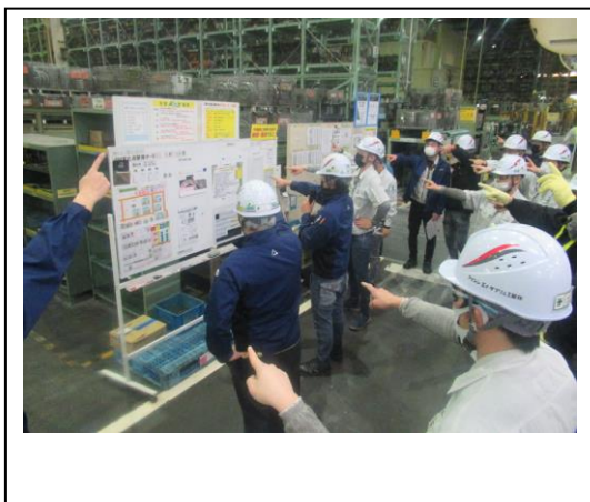
弊社の朝礼。終礼の状況(唱和)