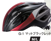
G-1 マットブラックレッド M/L