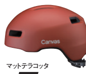
マットテラコッタ M/L