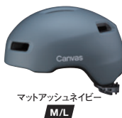
マットアッシュネイビー M/L