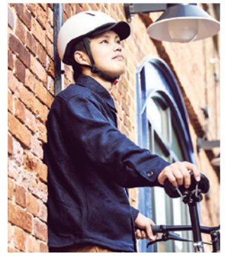
マットネイビー S/M M/L