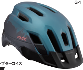
G-1 マットディープターコイズ M/L