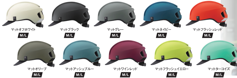
マットオフホワイト M/L