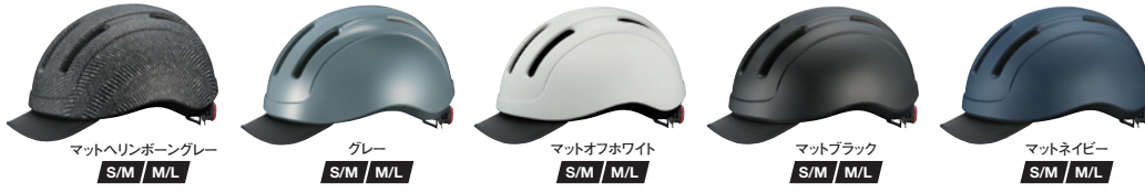
マットヘリンボーングレー S/M M/L