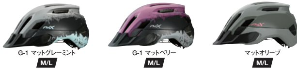
G-1 マットグレーミント M/L