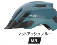
マットアッシュブルー M/L