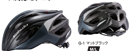
G-1 マットブラック M/L