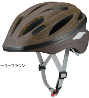
マットテールブラウン