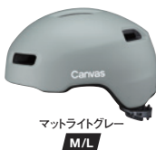
マットライトグレー M/L