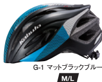
G-1 マットブラックブルー M/L