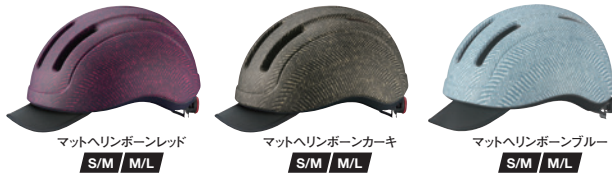
マットヘリンボーンレッド S/M M/L