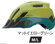
マットイエローグリーン M/L