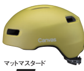
マットマスタード M/L