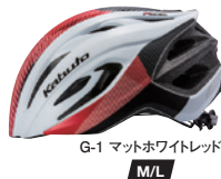
G-1 マットホワイトレッド M/L