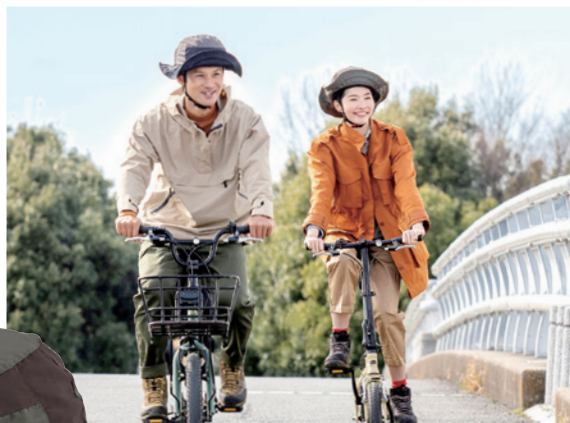
※公道では並走禁止です。(公園内で許可を得て撮影しています。)