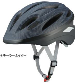
マットテールネイビー