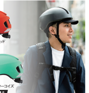
マットターコイズ M/L