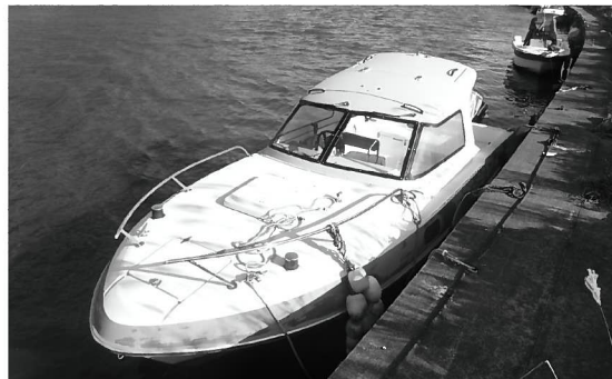
写真：井の口川（令和4年12月15日撮影）

井の口川に船舶の係留や係留杭などの設置が多数見られます。河川管理者の許可なく、河川の土地（水面も含む）に船舶を係留することは河川法第24条違反です。また、係留杭などの工作物を設置することは河川法第26条第1項違反です。