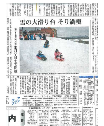
県民福井 令和3年1月29日 4面