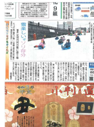
福井新聞 令和3年1月29日 3面