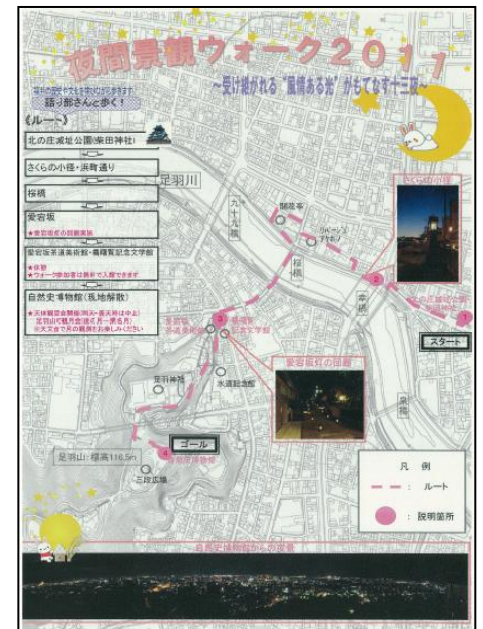
【 チラシ 】