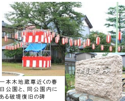
一本木地蔵尊近くの春日公園と、同公園内にある破堤復旧の碑