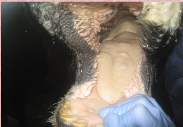
口内の水ぶくれ(初期の症状)