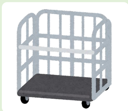
紙資源回収ボックスの例