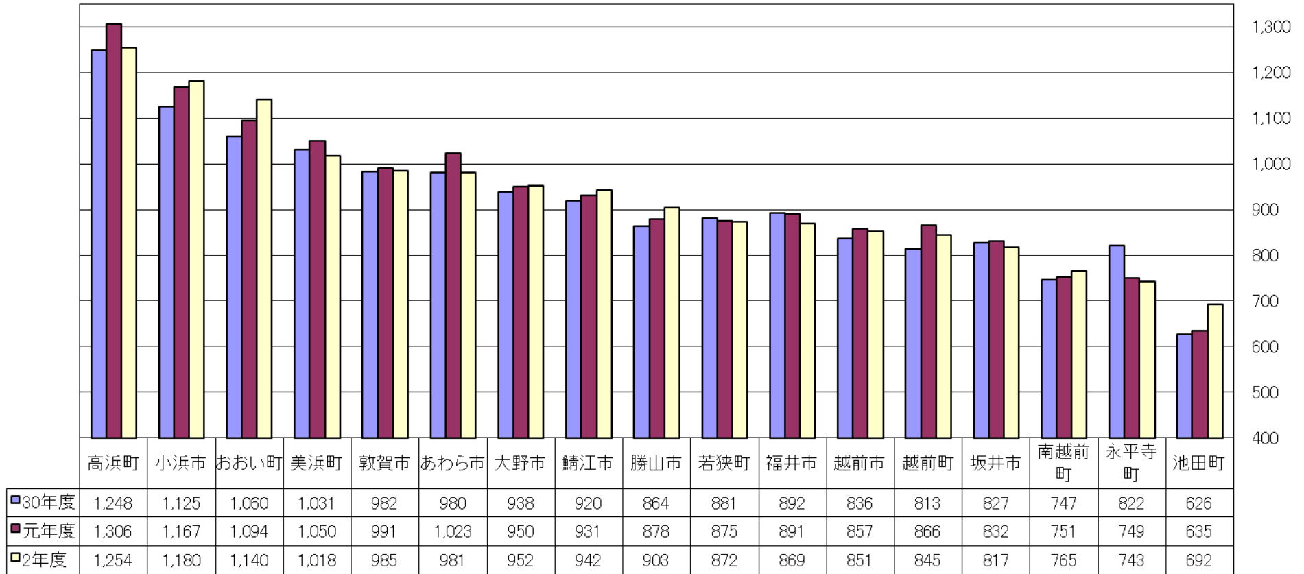
図-1 1人1日当たり排出量