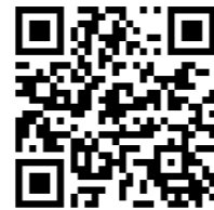
公立若狭高等看護学院 HP