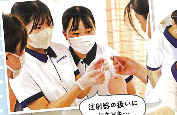
注射器の扱いにドキドキ...