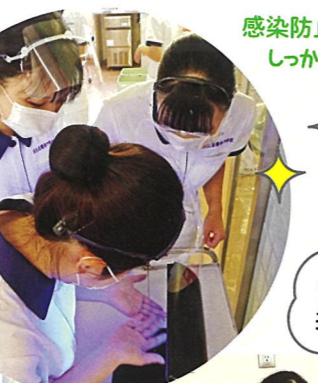
感染防止の技術をしっかり学習!