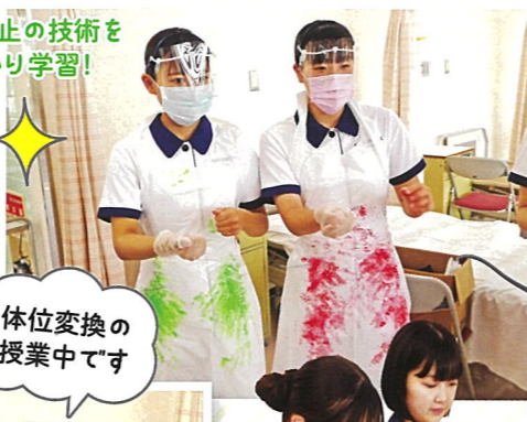
体位交換の授業中です