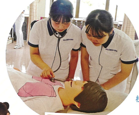
校外での学習もあります!