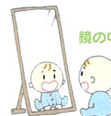
鏡の中自分とお話