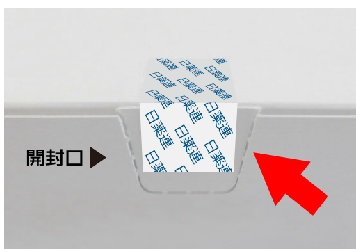
ミシン目が切れている