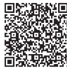
中国語(簡体字) 简体中文